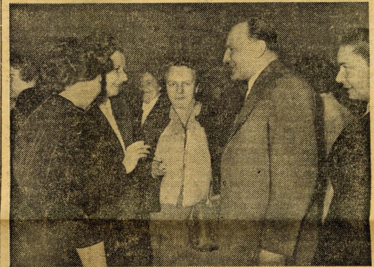
Kádár János elvtárs a kitüntetettekkel beszélget.

Hétfőn a SZÖVOSZ székházában a földművelésügyi mozgalom legkiválóbb nődolgozóit ünnepelték. A földművelésügyi mozgalomban végzett eredményes munkáért 44 nő kapott „Kiváló földművelésügyi dolgozó”, illetve „Kiváló belkereskedelmi dolgozó”-jelvényt és pénzjutalmat. A kitüntetettek tiszteletére a SZÖVOSZ igazgatósága fogadást adott.