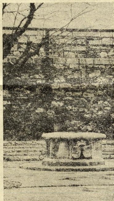
Mátyás és Beatrix feltárt kútja

tal mindenkinek magára vonta figyelmességét.”