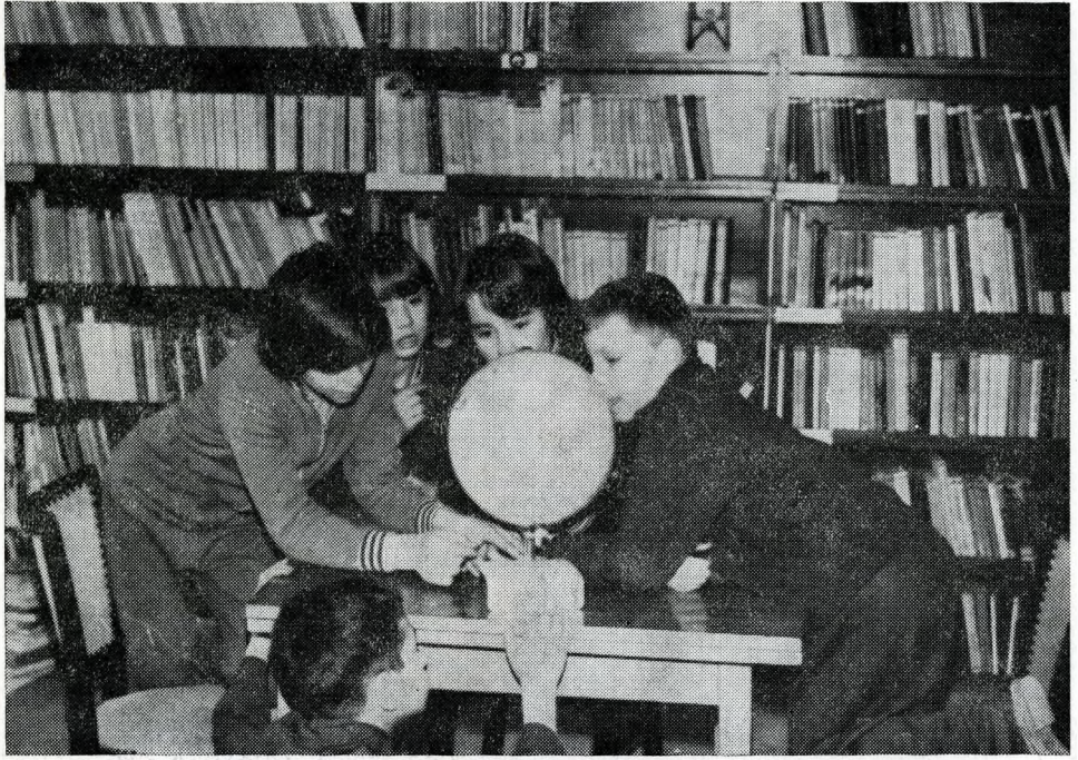
Felső képtünkön a budapesti Münnich Ferenc Nevelőotthon, az alsón a Fővárosi Általános Iskola és Nevelőotthon (Balatonboglár) könyvtára látható. Cikkünket lásd az 523. oldalon