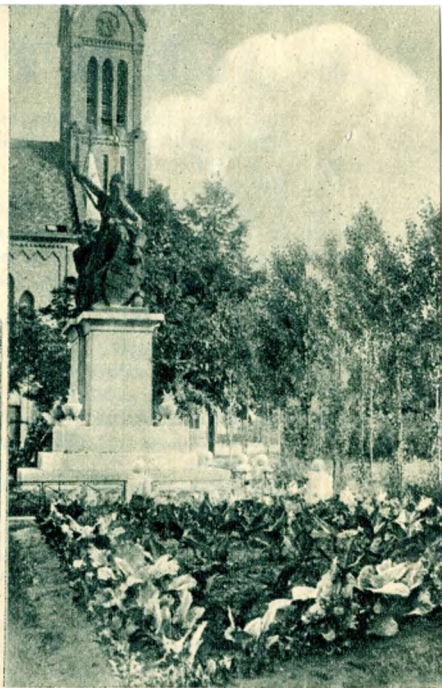
A „legkisebb földbirtok“ a Keletinél