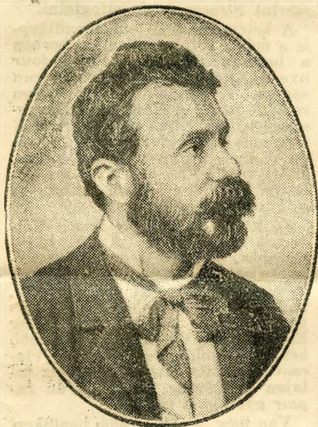
Rákosi Jenő a Népszínház első direktora