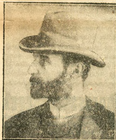
Konti József a nagy karmester és komponista