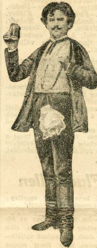
Tamásy József, Blaháné partnere a nagy magyar népszínmű színész