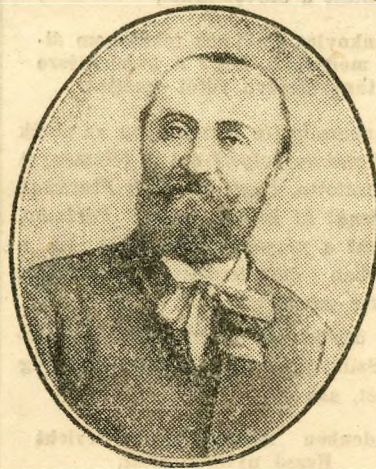
Kassai Vidor a komikusok komikusa, most 85 éves