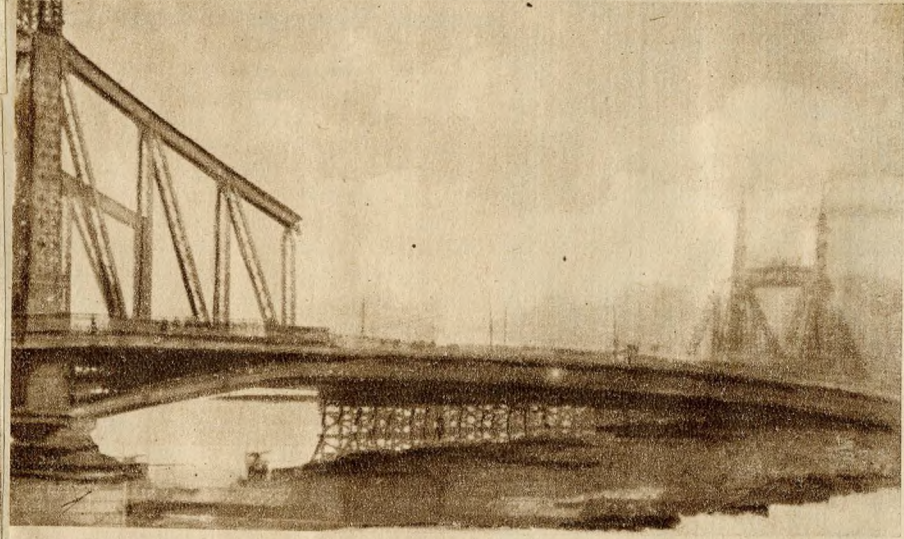
A Ferenc József-híd középső részét tartó uszályokat jégtorlaszok szorongatják

A Dunán megindult jégzajlás következtében a Pestet és Budát összekötő Ferenc József-híd középső részét le kellett szerelni. A lebontás előtt emberfeletti küzdelmet folytattak a munkások és szakemberek a híddért. A torló jégtáblákat robbanókötegekkel, később