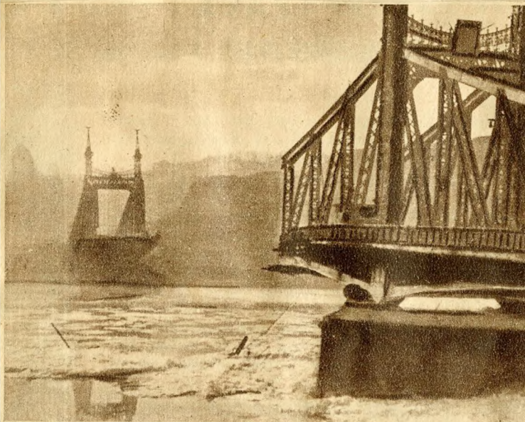
Megszűnt a kapcsolat a Gellért-tér és a Fővám-tér között... A Ferenc József-híd csonkjai árván állnak a ködös januári reggelen...