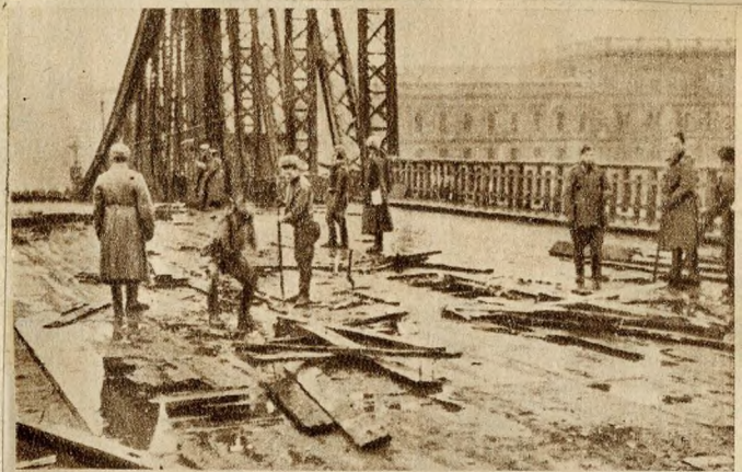
Vörös Hadsereg hidépítő alakulatai bontják a híd középső részét

aknákkal robbantották, de minden hiábavaló volt, ezért a közlekedésügyi minisztérium hidépítő osztálya a nyílások eltávolítását határozta el. A mérnökök és munkások ébersége, fáradtságát nem ismerő erőfeszítése mentette meg az uszályokat.