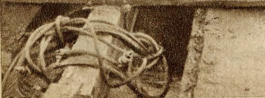
A középső hídrész és a régi hídcsonk találkozása