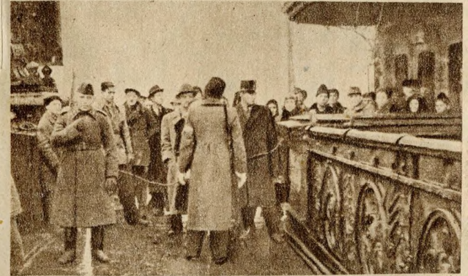
Pestiek, akik már nem mehettek át Budára