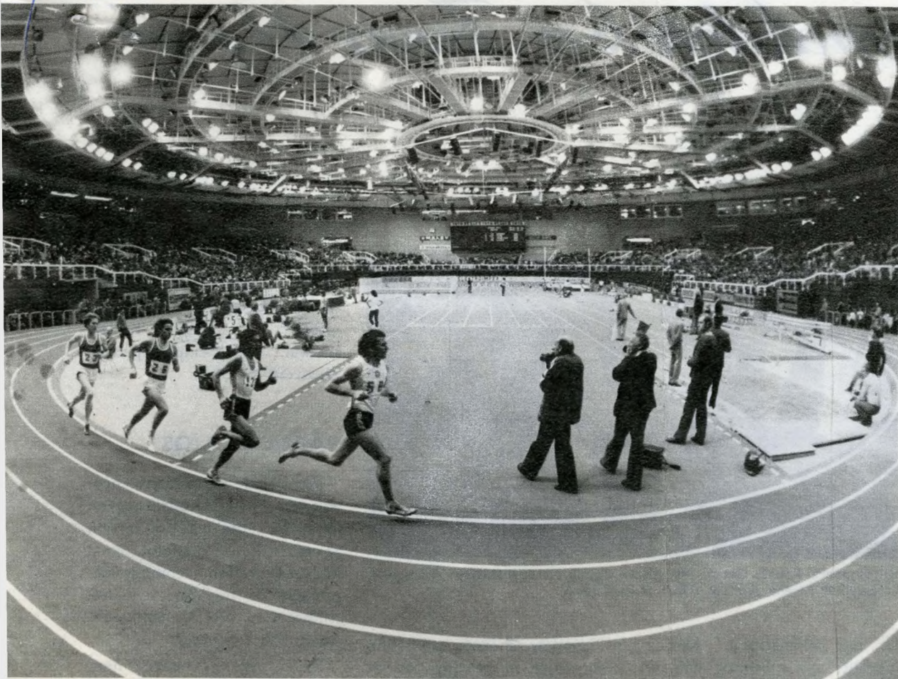
Magyarország—NDK atlétikai viadal

rangúak voltak az építészeti igények. Ott mindenki dolgozik, sürgő-forog. A sportcsarnokban 12 és fél ezer ember ülve tölt el órákat valamilyen esemény szemlélésében. Ehhez méltó építészeti keretet kellett és sikerült létrehozni. Pedig ilyen méretben ez ugyancsak nehéz. A belsőépítészeti szokott eszközei — falburkolat, szőnyeg, izléses bútorok — nem elegendők ehhez. Itt atmoszférát kellett teremteni, amelyhez hozzájárulnak a jó térarányok, a hatásos tetőszerkezet és a nézőtér felületét alkotó ülés-sorok játékos folthatása, további lehetőség a megvilágítás és mindezek felett: a bemutatók közép-pontba helyezése, a mozgó látvány „építészeti kihasználása”. A tervezők éltek mindezekkel a lehetőségekkel, a csarnok hatásában kifogástalan.