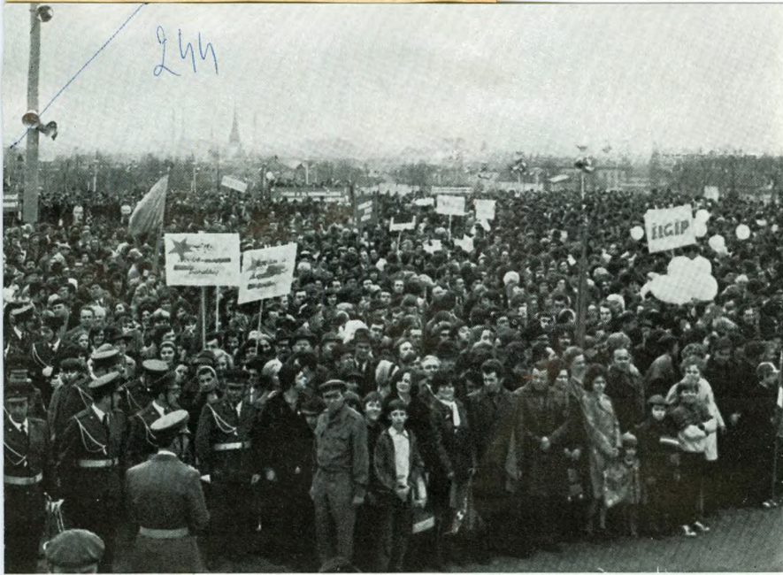
Tízezer fős ünneplő közönség jelenlétében került sor a park megnyitására