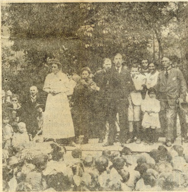
A gyerekeké lett a sziget (kép a Magyar Tanácsköztársaság idejéből).

ismerik. József nádor nagyszabású tervet dolgozott ki. A ferences templom közelében nyári rezidenciát építtetett és parkosította a szigetet. Az ország legszebb angolkerthévé alakította a hajdani Nyulak-szigetét.