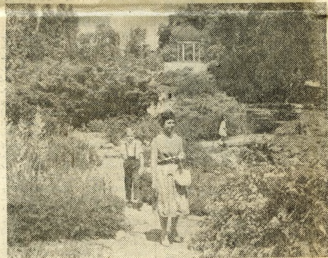
Tavaszi napsütésben séta a tavak mentén. Hátterben a ze-nelő kút.

Füstöl a sziget. A források fehér gőzszlopa, a koratavas hajnali párja: a füstlő nagy hajó itt, a híd előtt, a nyár felé — álomvízen — úszó sziget.