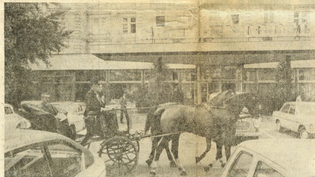
A fiaker a margitszigeti Nagyszálló előtt a századforduló hangulatát idézi.

Ybl álma: nemzetközi gyógyfürdőhellyé fejleszteni a szigetet. Még híd nélkül tervezte, akkor csak két kiscső szállította a