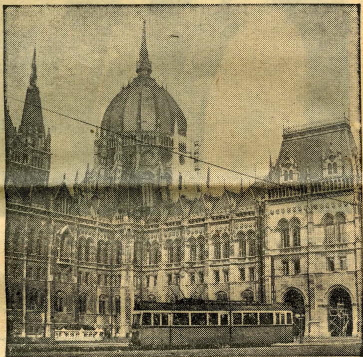
Nagy nemzeti értékünk: az Országház. Stílusa, gazdag díszítése ugyanolyan hűen tükrözi a régi uralkodó osztály pompa-szeretétét, mint kiváló építője, Steindl Imre művészetét

F inom ívű, karcsú tornyaival, csipkeszerűen megalkotott csúcsaival, káprázatos kupolájával, 96 méteres tornyán a vörös csillaggal, büszkén emelkedik a Duna pesti oldalán ez a világszerte megcsodált építészeti remekmű: az Országház. Már külső képének varázslatos szépsége is megragadja a látogatókat, de ha belépünk az egyik nehéz tölgyfalkapun, csodálatunk szinte az áhítatig fokozódik. A szemkáprázlatban szép termekben kis szobrok, híres festmények, drága márványoszlopok gazdag tárháza fogad. Gyönyörködhetünk Munkácsy Mihály, Rudnai Gyula, Lotz Károly, Vajda Zsigmond festőművészek képeiben. Az egész épületen látszik, hogy alkotói mindent beleadtak, ami a XX. század művészetéből szép és értékes volt.