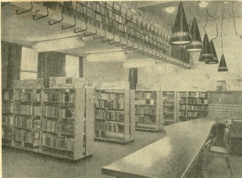
A Liszt Ferenc téri Szabó Ervin gyermekkönyvtár.

ográfiáját — annak megjelent első kötetét most követi a második, majd még sorozatosan öt kötet —, valamint a Tolsztoj és Krúdy életművét bemutató kötetek: emeljük ki, külön figyelmet érdemel. Ez a könyvkiadás abból a helyes szándékból született, hogy a könyvtárnak minden kulturális eszközt igénybe kell venni (kiállítások, ankétok, bibliográfiák, sőt koncert, film, továbbá sajtó és könyvkiadás), amivel csak a könyvtár és olvasói kapcsolatát szolgálhatja.