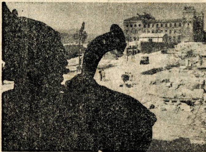
Az építkezés előterében a „Királyi vadászat” szoborcsoportozat kürtös alakja, háttérben a volt főhercegi palota.

A budai hegyvidék száz holdnyi új erdőt kap. A legtöbbet Csillaghegy és Békásmegyert felett, a Péterhegyen és a Rókahegyen telepítik, hajdani kőbányák helyére, sziklás, köves talajra. A régi budai erdőket 120 ezer csemétével felújítják. Az idén néhány különleges, eddig csak arborétumokban díszlő fa- és cserjefajta került a budai hegyekbe. A Budapesti Erdőgazdaság kamarerdei csemetekertjében negyvenféle egzotikus növényt szaporítanak.