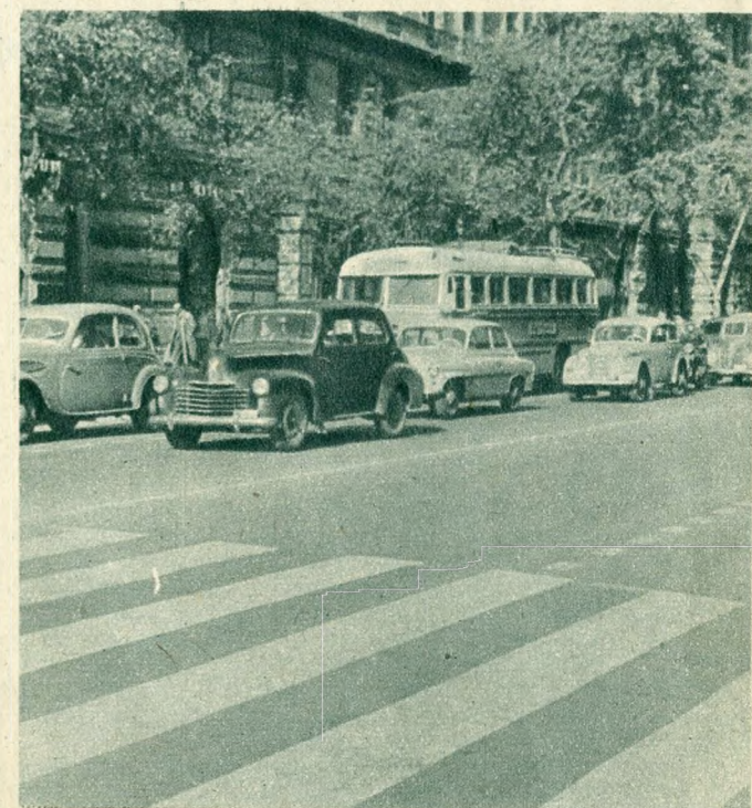
Örülünk annak is, hogy a növekedő autóforgalom megköveteli már nálunk is a korszerű jelzéseket.