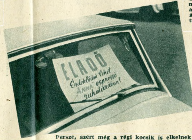
Persze, azért még a régi kocsik is elkelnek; de az eladásnak ilyen módját, amint ezt a belvárosban álló Ford-Eiffel sportkocsin vettük észre — koráb-ban nem igen láttuk. És mi ezt is jó jelnek tartjuk