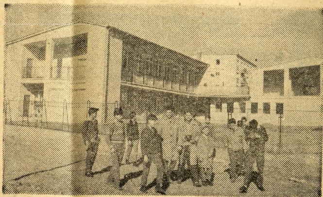
Olyan ez az épület, mint egy mesebeli palota. Ebben töltik napjaikat a legkisebbek: az óvodások