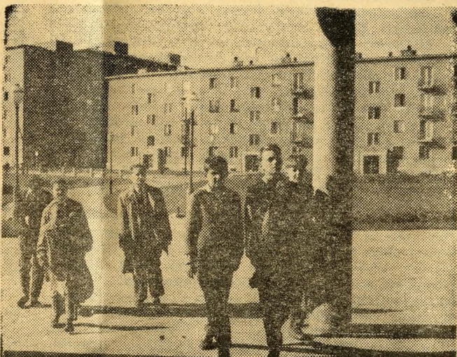
A Belvárosban sincsenek ilyen gyönyörű bérházak, mint itt. Az ember szeme megpihen, ha ezeket látja