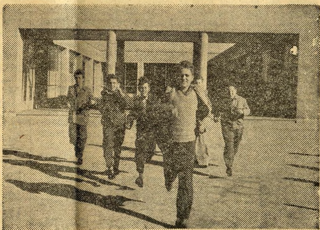
Fut, fut a Sas-örs a játszótéren. Egy ilyen tartalmas vasárnap délelőtti séta után jól tesz a felfrissülés, kis játék

Igy azután mihelyt egy emeletet befejeznek a munkások, a lakók azonnal be is költözhetnek.