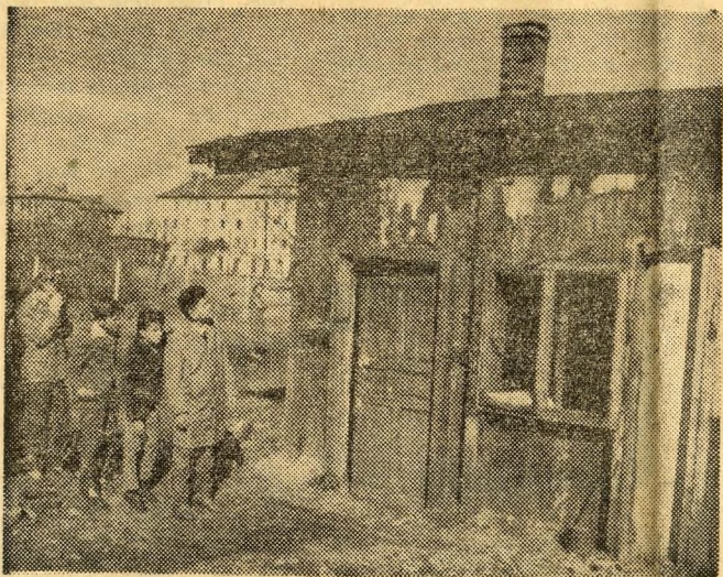
Ők még látták, de az utánuk jövő pajtások már nem láttak semmit a múltból. Hadd örökítse meg a múlt egy darabját a fényképezőgép.

Nem mindennapi kiránduláson voltam a múlt vasárnap délelőtt. A budapesti Medve utcai Általános Iskola 466-os számú Bem József úttörőcsapatának Sas-örsét kísérem el. Nem az őszi erdőt, a lombját hullató fákat, nem a budai hegyek avarborította ösvényeit kerestük fel. Nem! A város peremét látogattuk meg. Úgy is mondhatnám, hogy egy kicsit a múltban jártunk, nagyjából a jelenben, és a jövőbe is bepillantottunk.