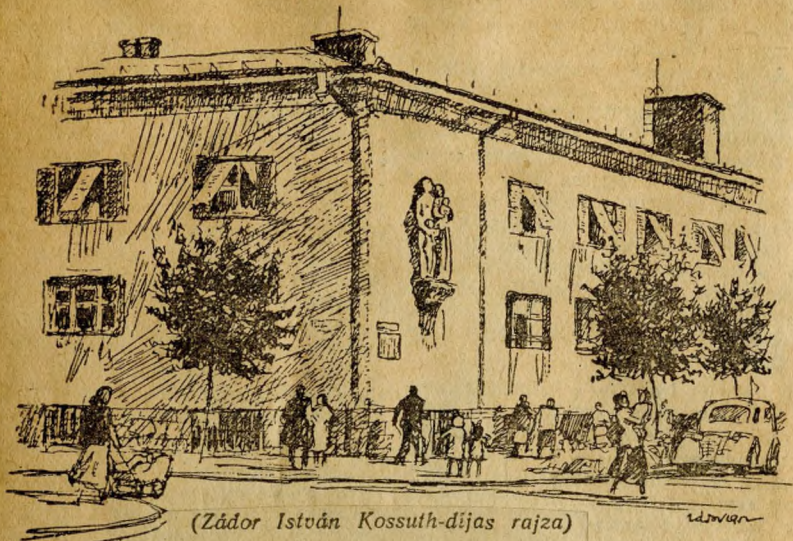
(Zádor István Kossuth-díjas rajza)