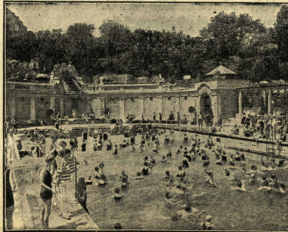
A Gellért hullámfürdője