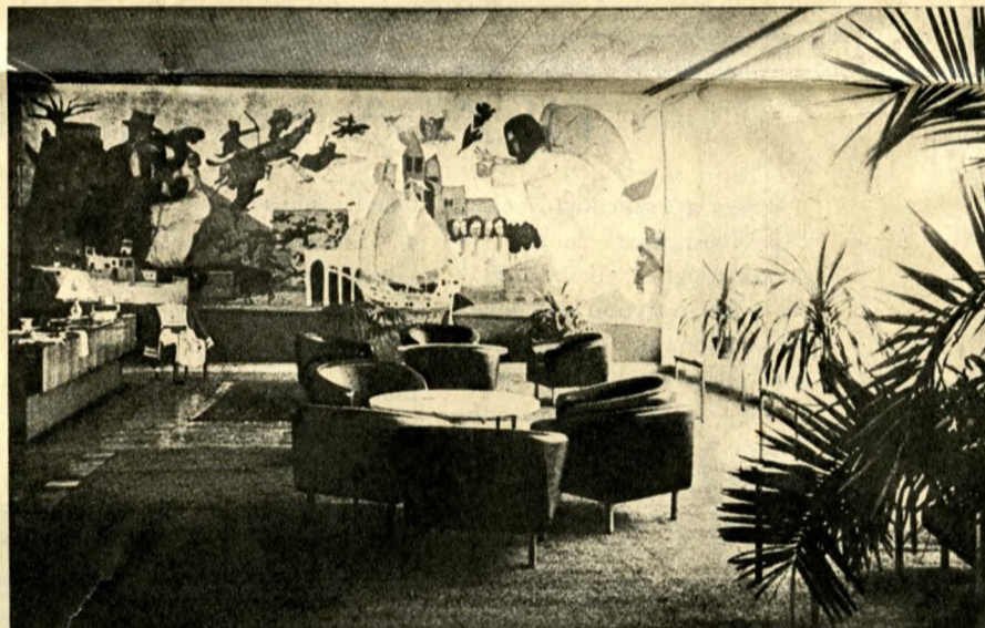
A Nagyszálló előcsarnoka, Kondor Béla falfestményével