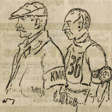
A verseny elnöke és a motor-kerékpárverseny győztese

közönségnek, annál jobban a pártján állott az idő. Száraz, hűvös, de azért nem kellemetlenül hideg időben futották le a nagy nemzetközi autoversenyt, amelyre különösen Bécsből jött számos versenyző. A bécsi konkurencia erősen éreztette hatását és bizony a díjak legnagyobb részét nem magyar versenyzők nyerték el.