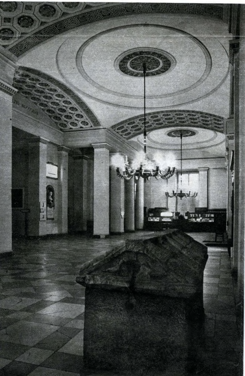
Belső tér a Nemzeti múzeumban