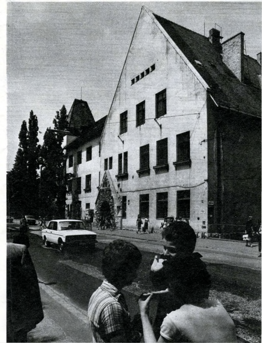
A Városmajor utcai iskola