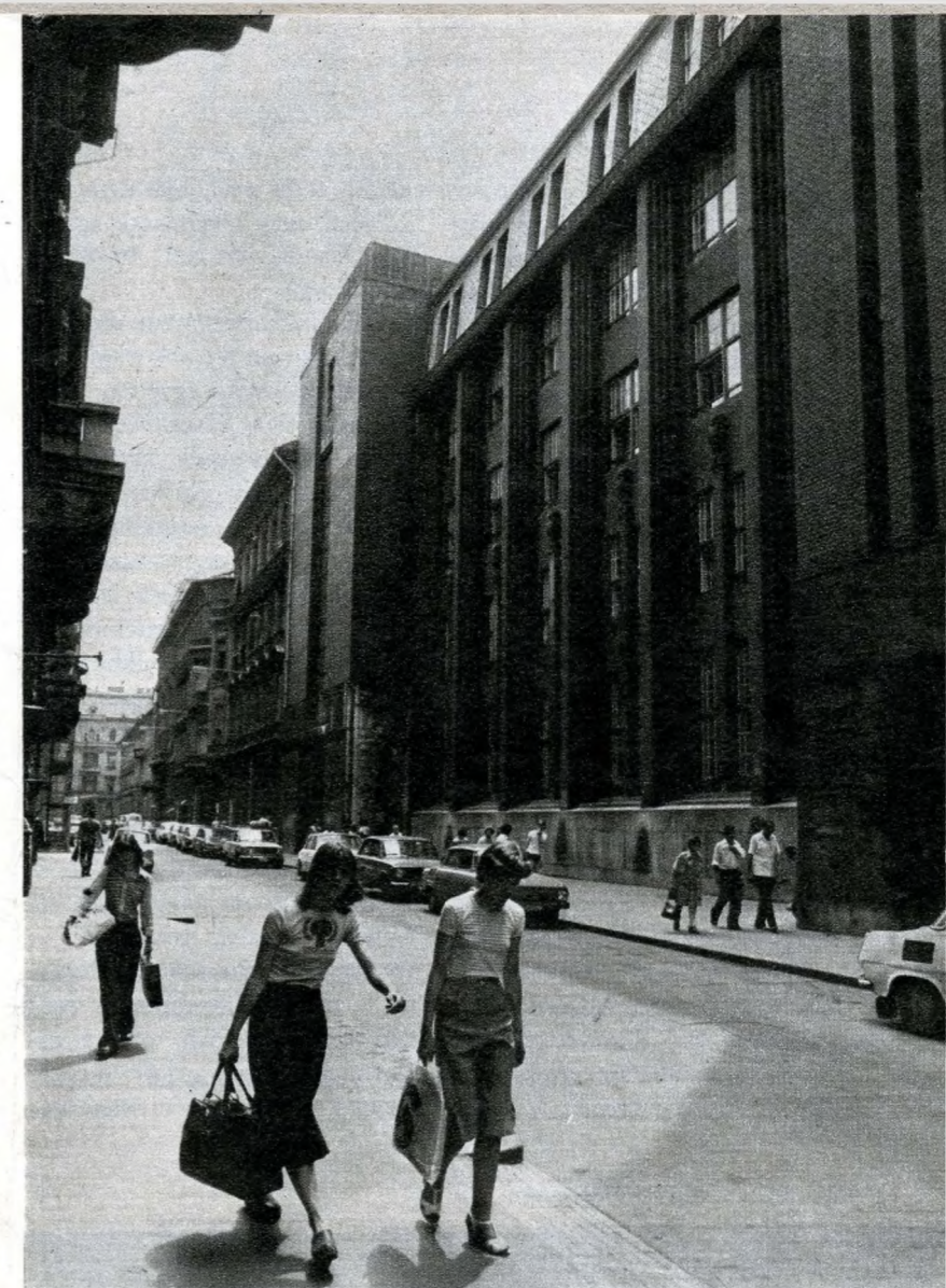
A Vas utcai iskola

Lajta Béla másik maradvány alkotása a Gázművek háza (Rákóczi út 18.), amely szintén az első világháború előtt, tehát a Bauhaus mozgalmát megelőzve épült. Nemcsak a vöröstéglás homlokzatát, hanem az épület szerkezetét is tanulmányoztuk már ifjúkorunkban, mint a legjobb értelemben vett modernség példáját. A két háború közti neobarokk ál-architektúrával, a rosszul szerkesztett épületre odacsapott érzelmes malterdíszekkel összehasonlítva, még becsesebb volt nekünk ez a hagyomány. És persze a Vas utcai kereskedelmi iskola épülete: szintén Lajta Béla alkotása. Ennek azonban van egy hibája, amelyről a tervező nem tehetett: a szűk utcába besorolt monumentális kiképzésű házra nincs sehonnan olyan rálátás, mint akár a Rózsavölgyi-házra, akár a Gázművek házára. Ha egyszer egy városrendezési akció lebontatna minden épületet a Vas utca és a Rókus vagy pláne a Corvin Áruház között, akkor tudnánk meg, milyen szép ez az iskola. A feltételezés persze abszurd, a telegkijelölés egykori kényszere végérvényesen beszorította ide Lajta Béla alkotását. De legalább egy mondatot kell szólni