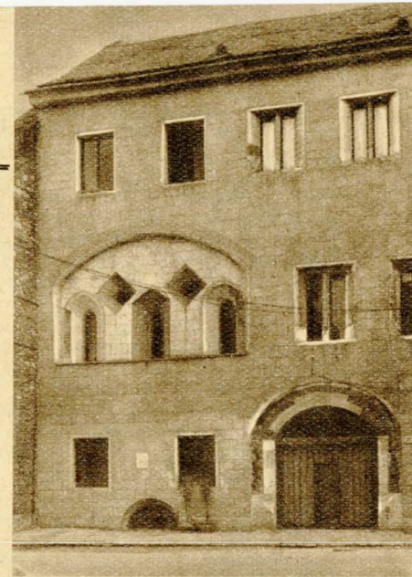
3. ábra. Az Úri u. 31. sz. házat eredeti gótikus formájában sikerült restaurálni. Az egyetlen kétemeletes gótikus lakóház a Várban