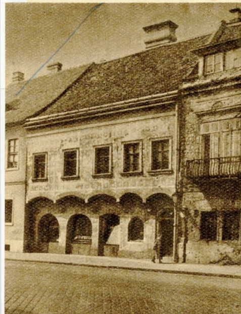
2. ábra. A Tárnok u. 20. sz. közép-kori épület, emeleti ívsora csak 1945-ben vált láthatóvá. Az ívsor alatti földszinti rész be volt falazva. A homlokzati festést a megmaradt részletek alapján restaurálták. Az emeleti ablakkeretek már barokk eredetűek.