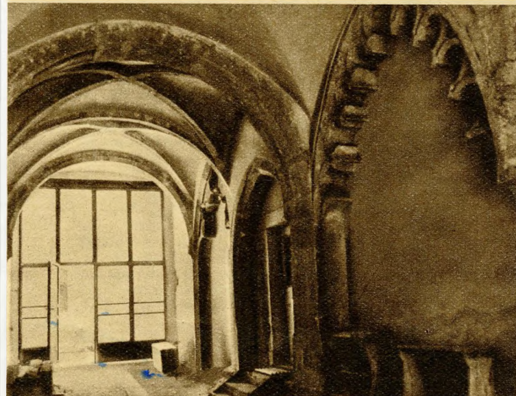
5. ábra. Úri u. 40. A díszes gótikus kapualj restaurálás közben

Az emeleten voltak a lakoszobák, köztük a néha díszterem szerepét is betöltő nappali szobával. A földszinten — a kapualj két oldalán — boltozatos üzlethelyiségek állottak (innen ered a „bolt” szó). A széles kapualjon a kocsik is bejárhattak. Innen nyílt a lépcsőház, az udvar, a pincelejáró. A kapualjat gyakran ülőfülkék, úgyneve-