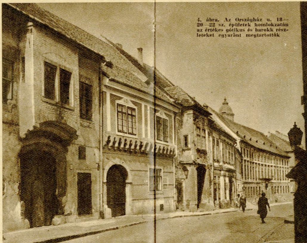
4. ábra. Az Országház u. 18—20—22 sz. épületek homlokzatán az értékes gótikus és barokk részleteket egyaránt megtartották

Az 1945. évi ostrom pusztítása azonban ismét felszínre hozta a rég eltakart maradványokat. Az újabbkori épületekről lehullott vakolatrétegek alól a szétroncsolt falak romjai között középkori épületrészek tűntek elő nem sejtett