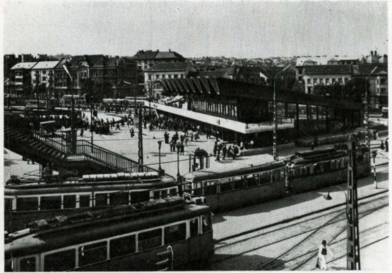
A Moszkva téri metróállomás

míg az autósok, az autóbusz és a villamos számára a tér rendezése, ha nem is teljes értékű, de az eddiginél mindenképpen jobb megoldást nyújt, addig a gyalogosok, a metró és az autóbuszok közötti átszálló forgalma csupán különböző úttesteken és síneken többszöri veszélyes áthaladás után, tekervényes módon lehetséges. A sínekkel, gyalogos átjárókkal felszabdalt tér megoldatlansága esztétikailag is zavaró .