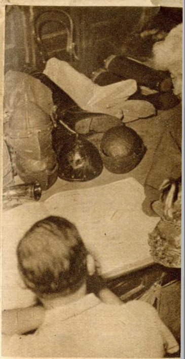
Minden kelléket, ruhadarabot anyakönyv készíthető ki időben Lohengrin hattyúcs ezüstkürtje...