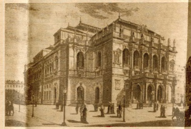
Az Operaház első tervrajza

nagyobb, mint a nézőtér, területe 957 négyzetméter. Az első színpad hossza 24 méter, a hátsó színpadé 19 méter. A zsinórpaddal és a felette lévő kerékpaddal 40 méter magas. Az úgynevezett asphaleiával, víznyomásra működő berendezéssel 84 darab zsinóron függő díszlethordó traverz emelhető fel és ereszthető le. Egy-egy nagyopera előadásakor körülbelül négyezer négyzetméternyi festett díszlet emelkedik fel s ereszkedik alá. S micsoda változatok, a mese képzetének milyen ezerszínű rajzai! Hullámozó, viharos tenger és sziklás spanyol hegyek, olasz verőfény, középkori sikátorok homálya, várfal és börtönudvar, faunjárta erdők és felkelő seregek táborai. Kastély és kunyhó, lovagtorony és nádtetős parasztház, messzi kanyargó utak, virágos mezők, ahová a muzsika álmai vezérelnek... És aztán