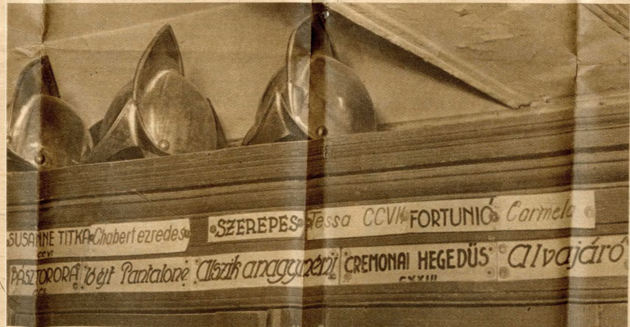
Az elfelejtett operák ruhaszekrénye