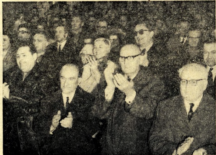
Nagy taps követi Kádár elvtárs beszédét.