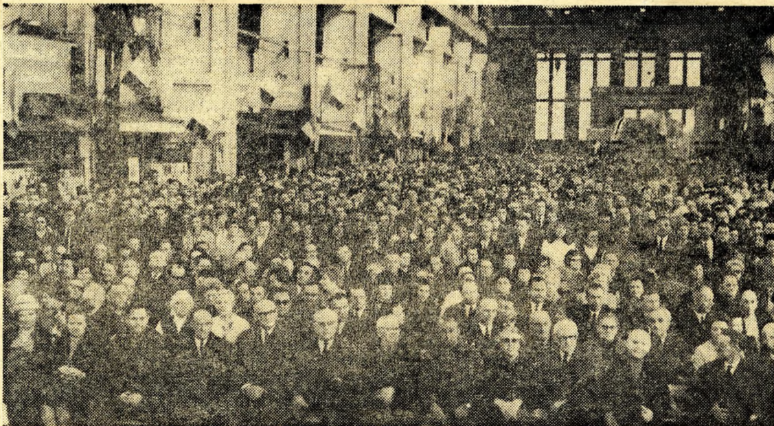
A nagygyűlés résztvevői a Láng Gépgyár üzemcsarnokában.

Hangsúlyozottan és nyugodtan mondhatjuk, hogy a Központi Bizottság mérlege pozitív volt.