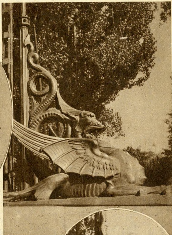
A ligeti sárkány.