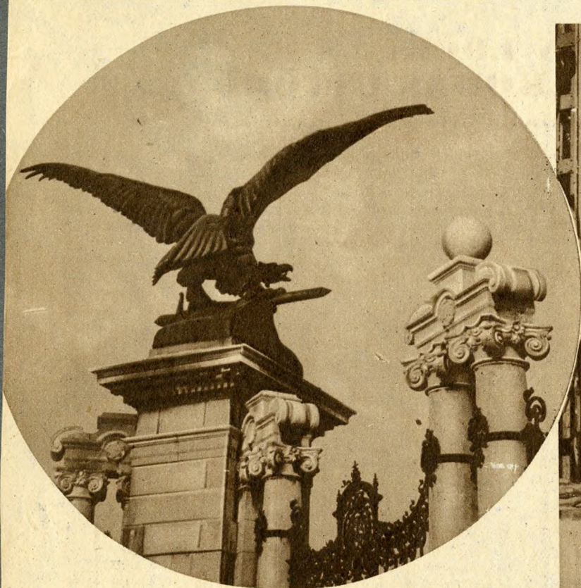
Turulmadár a Várban.