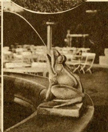
A margitszigeti óriás béka.