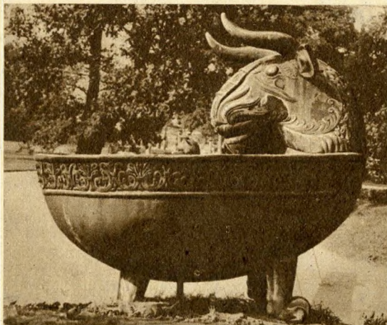
Virágtartó a margitszigeti Arany János szobor előtt.

Lehet, hogy a városrendezők bölcsesége is erre gondolt, mikor a liget bejáratához odaállította a sárkányokat s mindenütt a kertekben elhelyezett pár mesebeli figurát.