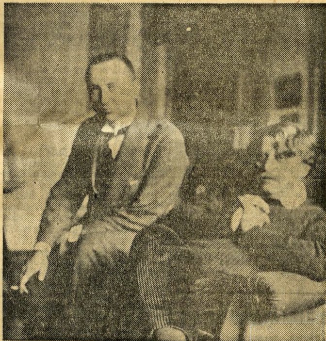
Bölöni György és Rippl-Rónai József Párizsban

— Bölöni halálhíre elkéserejt, de nem változtat azon, amiről már első találkozásunkkor megbizonyosodtam, fog.