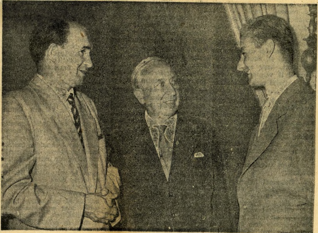
Az utolsó felvétel: A csehszlovák íróküldöttség tagjaival.

Most, amikor az írók jó része s egy számottevő új nemzedék dicséretreméltóan,