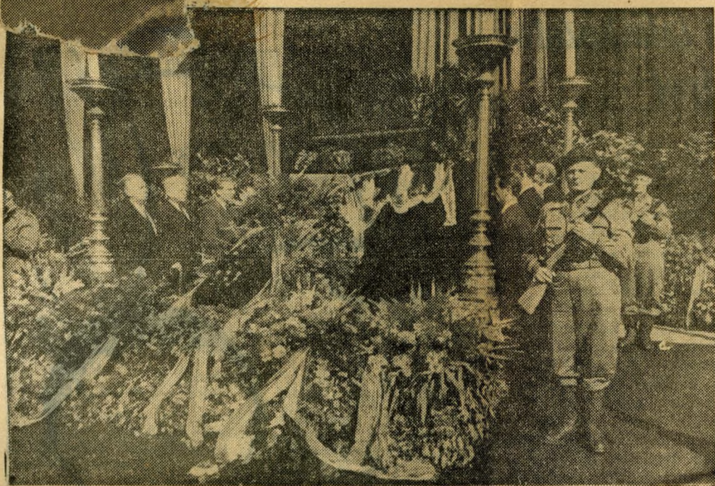
A végső búcsú