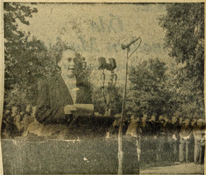
Benke Valéria művelődésügyi miniszter emlék-beszédét tartja