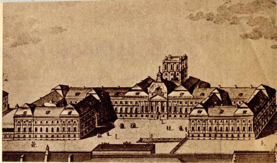
A budai egyetem palotája 1780-b.n.

Maga Budapest tele van egyetemi intézményekkel és épületekkel. A Központi Egyetemről északra megpillantjuk az Egyetemi Könyvtár palotáját, a mult század legszebb épületét, amelynek Lotz-freskóit most gyönyörűen megtisztítva fogják látni a látogatók az ott rendezett egyetemi kiállítás fölött. Délre, a Múzeum-köruton a Bölcsészeti Kar pavillon-csoportja — valamikor Műegyetem — ad derűs képet ennek a városrésznek. Az Üllői-ut elején és végén az Orvoskar klinikái emelik a városképet, megállapodott architektúrájukkal. — Hosszu a sora az Egyetem különböző gyűjteménytársainak, muzeumainak és intézeteinek, amelyekhez e jubileumi évben a Csillagvizsgáló Intézet , a Földrendési Obszervatórium és