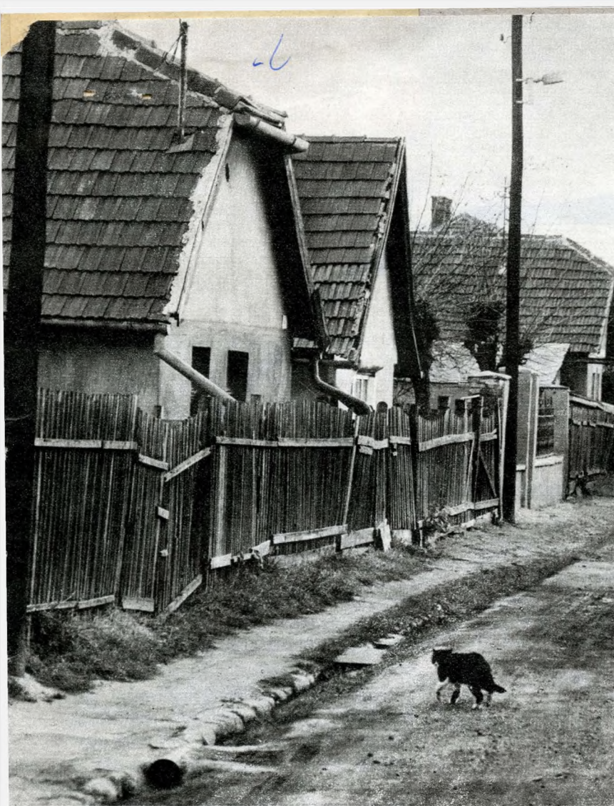
A „Sódergödör” házai

gánerőből megvalósuló lakások száma. Így természetesen a két közötti arány is megváltozik. Amagánerőből megvalósuló lakásépítés keretében növelni kívánjuk a teletszerű, több szintes konstrukciókban épülő lakások számát. A Fővárosi Tanács VI. ötéves tervében kerületünk az alábbi részletezésben szerepel: Újpalota (501-es épület): 84 (tanácsi célcsoportos); Ifjúgárda úti lakótelep 494, Énekes úti lakótelep 1024, Landler lakótelep 700 — az utóbbi három mind teletszerű