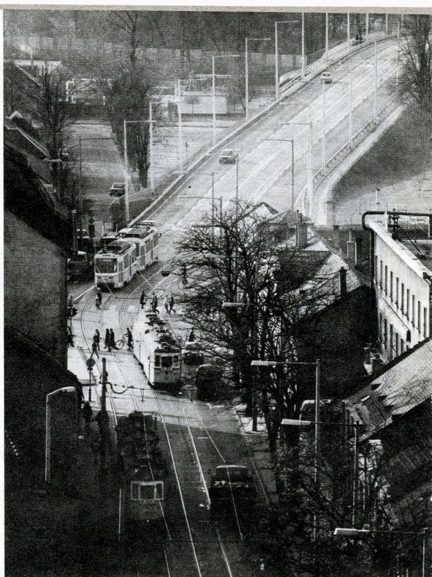
A felüljáró Újpesttel köti össze Rákospalotát

— Először arról, hogy mit sikerült tenni. A bölcsődei ellátás, újabb 180 férőhely építésével, valamennyire bővült. Így a bölcsődés korú gyermekek 32,8 százalékát el tudtuk helyezni. Kerületünkben a tervidőszak végén valamennyi indokolt esetben felvettük a jelentkezőket. Az óvodai hálózat 675 férőhelyet kapott, s mivel az óvodás korú gyermeklétszám növekedése na-