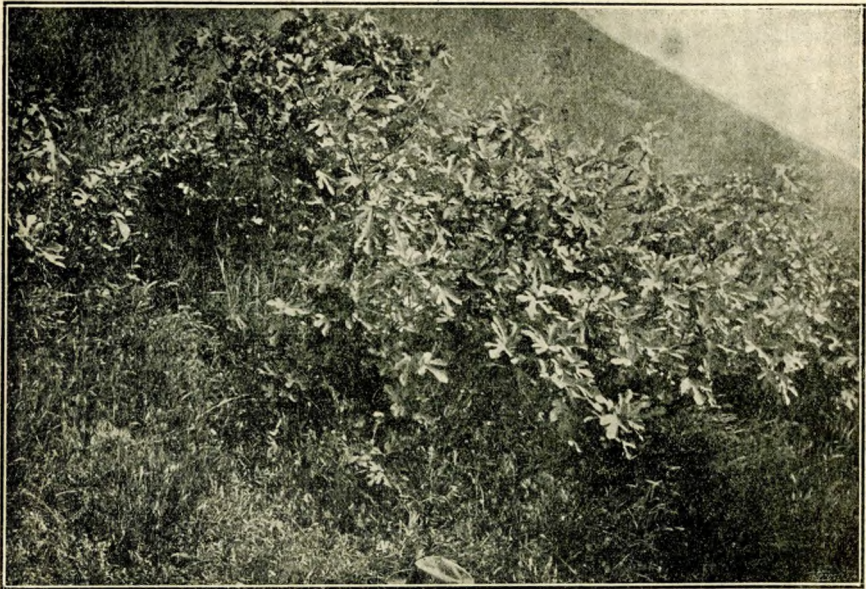
5. kép. A gellérthegyi fügefák 1902-ben. (FIALOVSKY L. nyomán.)

mely JÓZSEF nádornak szemefénye volt. Maga fedezte föl valamely olaszországi kertészetben és 1828-ban mint zsenge csemetét maga ültette a kastély elé. Az 1838-i nagy árvíz idején karvastagságú lehetett, a jégzajlás azonban eltörte s a pusztulás után a kertész bekötözve, összeragasztva, támogatva, gondosan ápolgatva, remegve várta a nádort. JÓZSEF nádor könnyezve állt meg rongyokba takarogatott kedvence előtt, de azután így szólt: Nyomorékot nem tűrök, fáj a veszteség, de tőből le kell vágni! — s levágatta. Hét ágat hajtott még az 1838-i tavaszon a csonka platán, a nádor mind a hetet meghagyatta és elnevezte a fát a Hét testvérnek.“