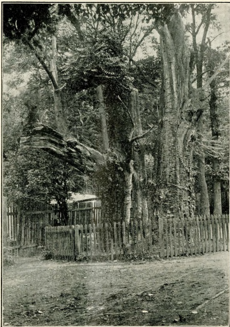
1. kép. A pécsbányatelepi „ezeréves“ gesztenye tuskója.

a gesztenyefánál kedvtöltést találván, csevegve távoztak. Meg volt pedig e fa 1840-ik évig, amidőn egy kapzsi velemi jobbágy birtokába kerülvén általa kivágatott azon reménnyel, hogy odvában