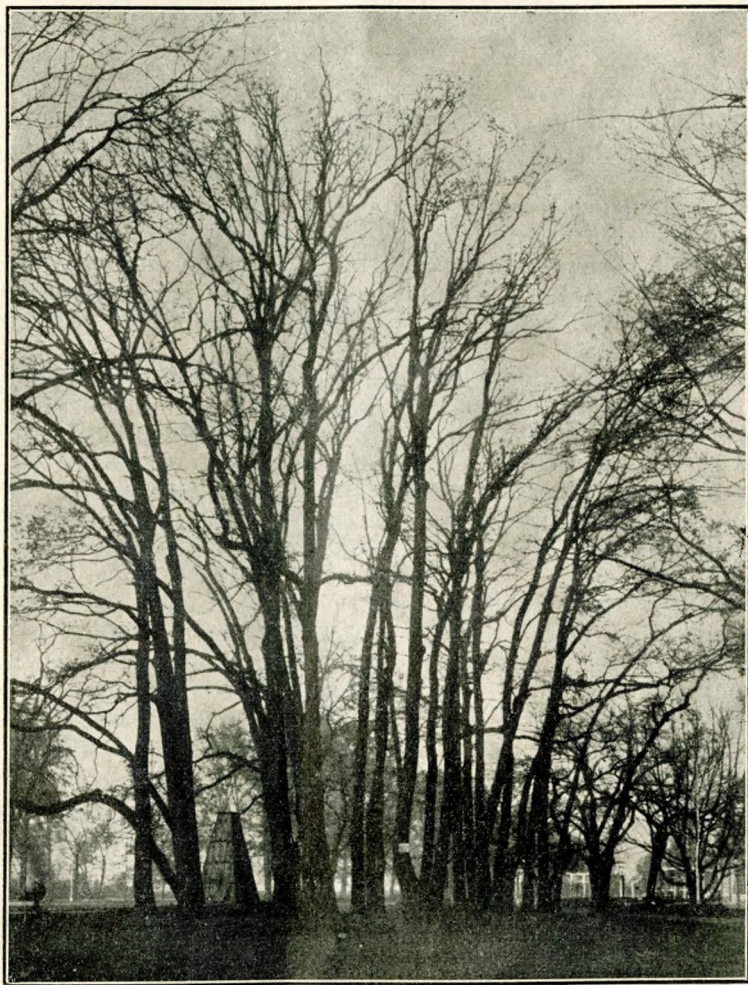
3. kép. ARANY JÁNOS tölgyei a Margitszigeten.

országgyűlést tartott alatta, vagyis olyan fejedelmi törvényfává avatta, mint amilyenekről bevezetőben szoltam. A tudálékosság a fa korát vizsgálva, foltozni akart a legendán, s azt mondta, hogy RÁKÓCZI korában ez a fa még suhanc volt, melyhez a fejedelem csak lovát