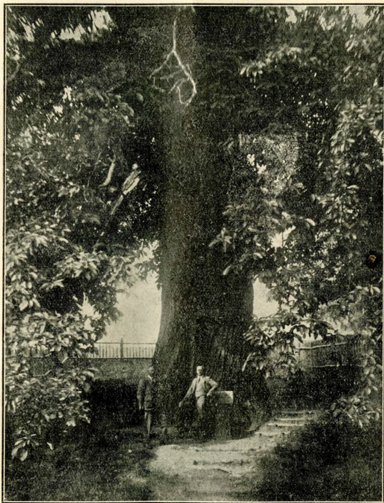
2. kép. A kőszegi CHERNEL KÁLMÁN-gesztenye.

ATTILA király — a göcseji földön járván — elfáradt seregével