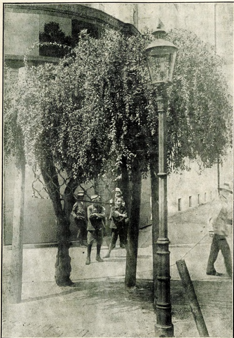
6. kép. A debreceni lícium.

végre felrázta a természetvédelem ügyében a magyar közvéleményt is. A természetvédelem tárgyai között hely illeti