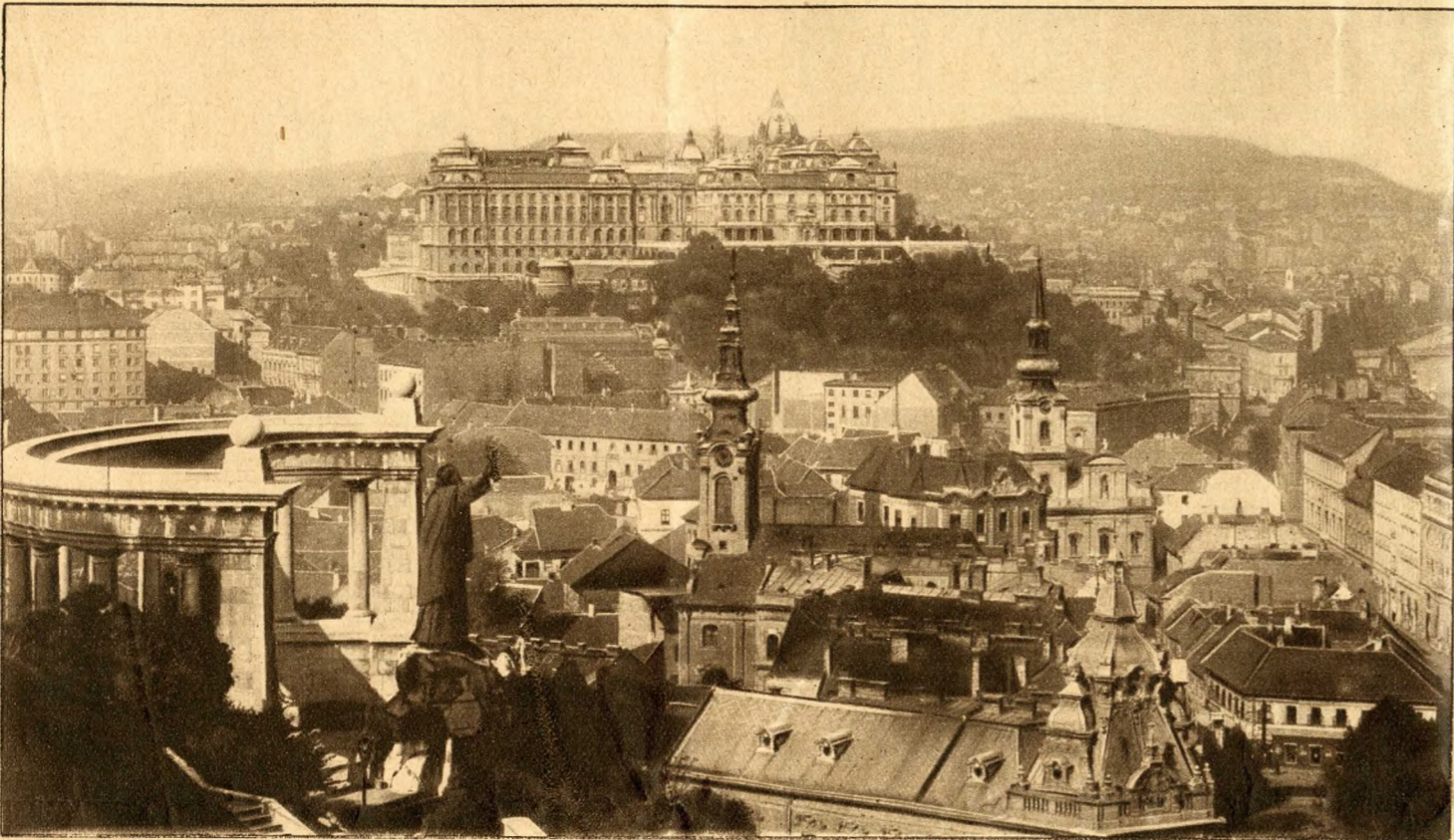
DIE KÖNIGLICHE BURG