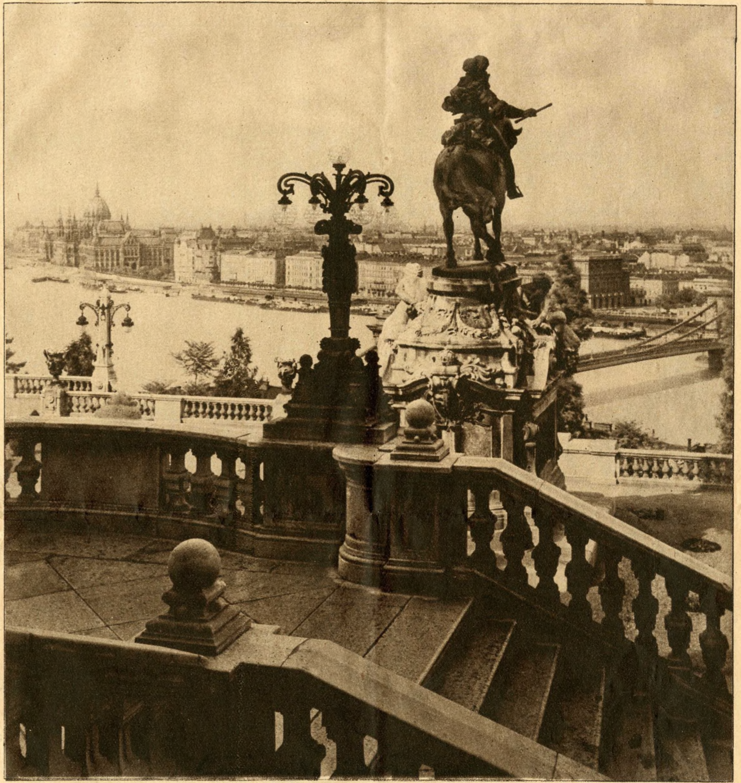
BLICK AUS DEM BURGGARTEN AUF DIE STADT