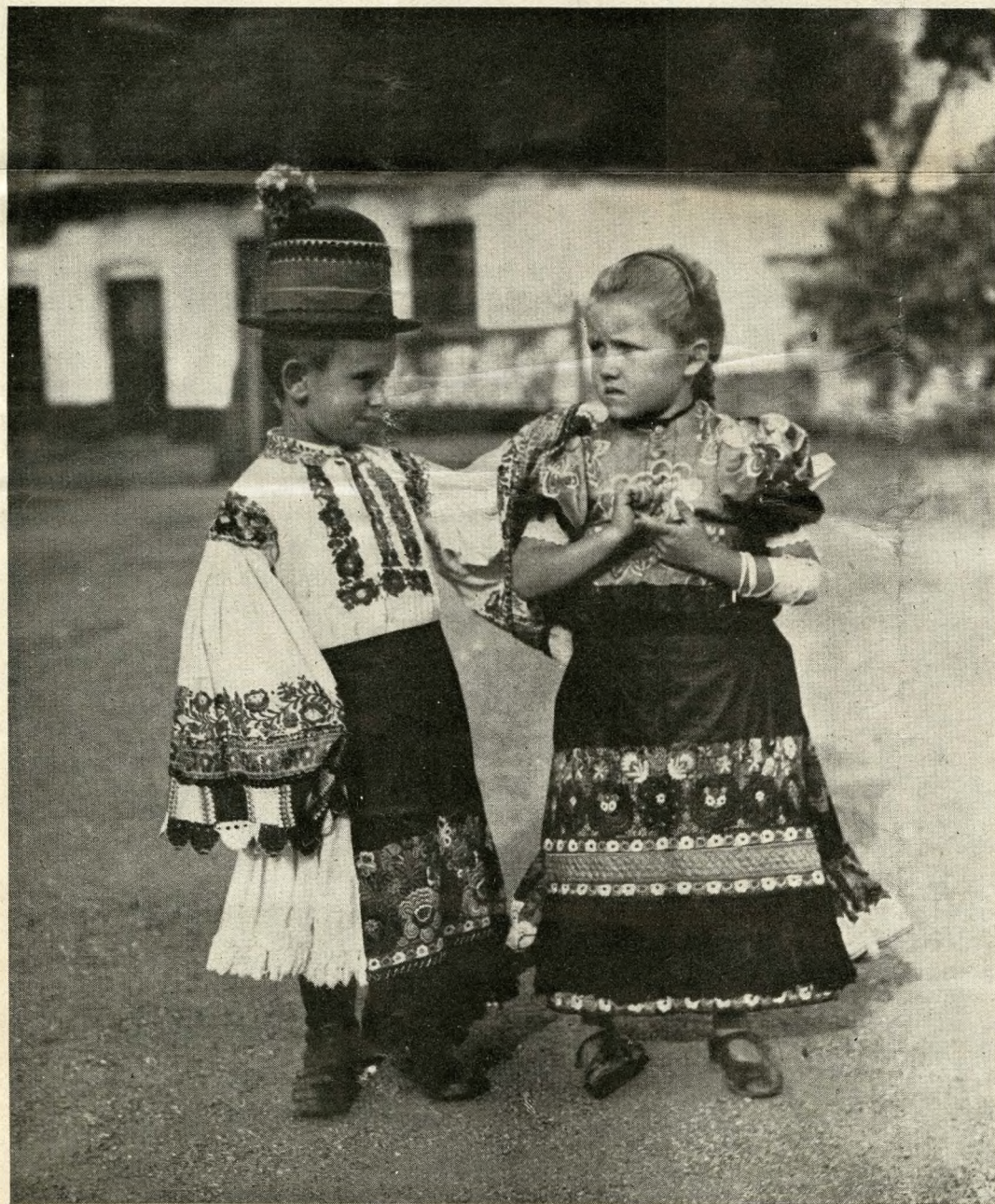
Para dziecięca w węgierskich strojach ludowych

W zachodnich Węgrzech, gdzie są jeszcze ślady panowania rzymskiego, i gdzie była najstarsza kultura węgierska, spotykamy się z wspaniałymi zabytkami stylu romańskiego, jak kościół dawnych opactw bernardyńskich w Ják i w Lébény , ruiny kościoła premonstratensów w Zsambék , majestatyczna katedra w Pécs , budowana na wzór bazylik włoskich, potężny klasztor opactwa benedyktyńskiego w Pannonhalma , i imponująca swoimi rozmiarami katedra w Esztergom (Ostrzyhom). Ale spotykamy się z pełnym urokiem starymi miasteczkami, jak Sopron , Köszeg , Veszprém .