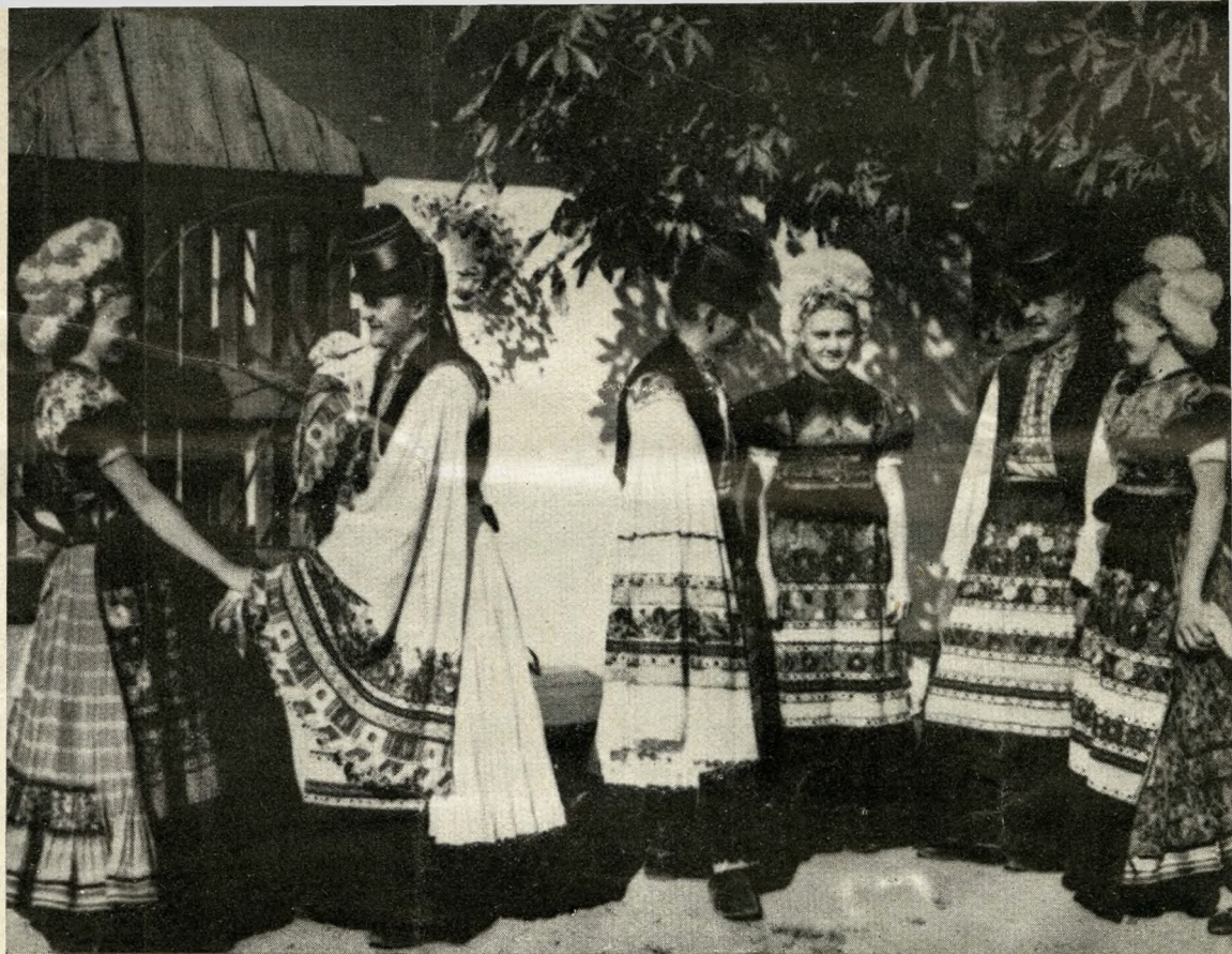
Typy wiejskie w Sárköz

Chociaż Węgry straciły \frac{2}{3} części swego terytorjum, mimo to pozostało jeszcze bardzo dużo malowniczych okolic i starych miast z pięknymi zabytkami dawnej architektury.