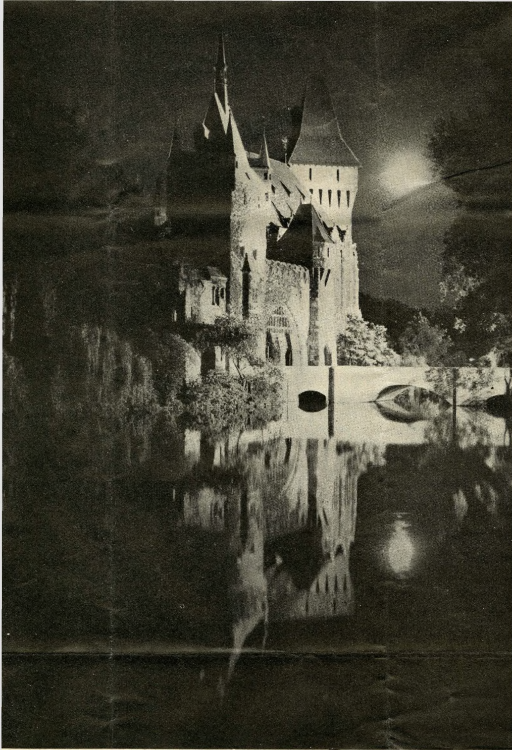
Oświetlony zamek Vajda-Hunyad w Parku Miejskim w Budapeszcie

Jak orzeł z gniazda, serce rwie się z łona, Patrząc w widnokrąg, bez brzegu, bez granic.