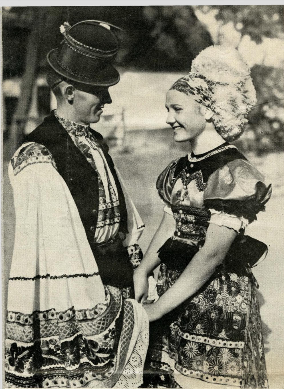
Narzeczeni z okolic Kálocsy

A wiele jest rzeczy do obejrzenia na Węgrzech. Sama stolica — Budapeszt w niczem nie ustępuje stolicom europejskim. Kto nie widział węgierskiej metropolji, rozciągającej się na dwóch brzegach Dunaju, ten nie może powiedzieć o sobie, że w Europie widział wszystko, co godne widzenia. Budapeszt, z wyjątkiem kilku dzielnic, jest nawskroś nowoczesny: królewski pałac w Budzie dumnie wznosi się