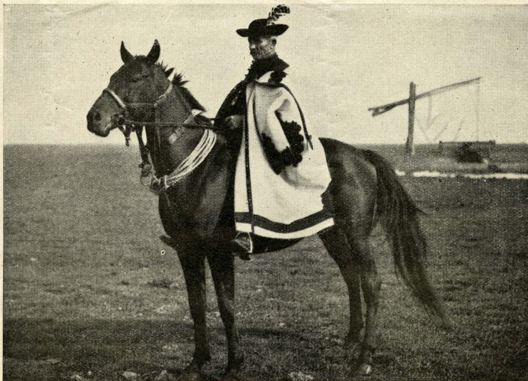
Pastuch (csikós) w Hortobágy