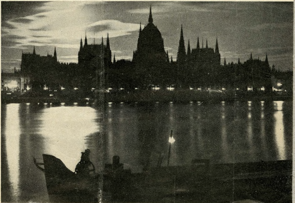
Parlament w Budapeszcie w nocy