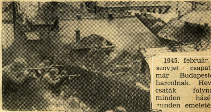
1945. február. A szovjet csapatok már Budapesten harcolnak. Heves csaták folynak minden házáért, minden emeletért.

A Kálvin téren már szovjet katonák mutatják az utat. „Halál a német hódítókra” — kiáltja a Kálvin téren felállított tábla.