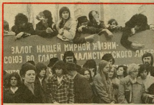
Fiatalkok a megnyitóünnepségen, akik közül majd' mindenki tett is a parkért