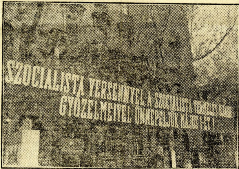
Hatalmas transzparenszek a Sztálin-úton.