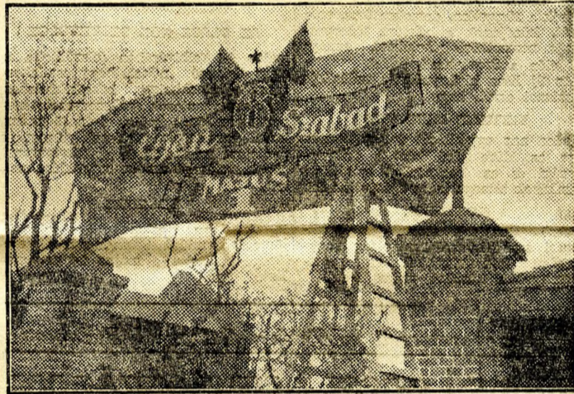
A Cseneli Posztó főbejáratának dekorációja

A dolgozók nagy ünnepén az összes dohánykísarudák egész nap nyitva tartanak, amellet »mozgó« kisárusok járnak kocsikkal a dolgozók között. Egymillió »Ot éves Terve« cigarettát, félmillió »Munkás« és 300.000 »Vir-