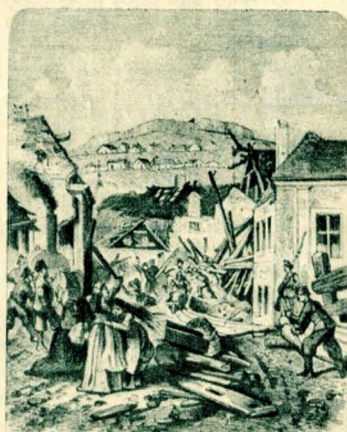
Az Ördögárok pusztítása (1875)