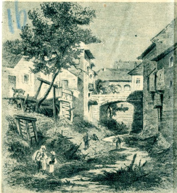
Részlet az Ördögárból a Rácvárosban (1872)

szában nyitott és gondozatlan lévén, a Gellérthegy és Várhegy között fekvő völgy állandó veszedelmét jelentette, két emlékezetes évben, 1837-ben és 1875-ben pedig olyan katasztrófának volt okozója, amelynek mindkét alkalommal emberéletek estek áldozatul.