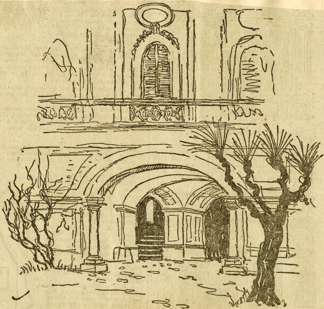
Az Országos Levéltár udvara