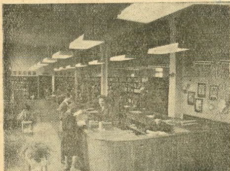
Részlet a 28-as Szabó Ervin Könyvtár szabadpolcos terméből

22. nálunk is kevésbé keresett könyv 60 példányának első oldalára beragasztottuk a jegyzék alapján gépelt annotációkat, s elhelyeztük őket az említett polcrészre, egyéb annotált könyvek társaságába. Az elfekvő könyvek könyvkártyáit tűzőgéppel jelöltük, s a könyvek forgását a napi statisztika készítésekor figyeltük. Az 1961. I. 16.—I. 27-ig tartó 10 kölcsönzési napon 35 könyv talált közülük gazdára. Több példányban is olva-