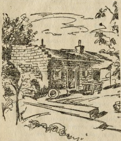
Ez volt a múlt: a régi világ „munkásalakása”.

Kilencvenkét új lakást adtak át hétfőn a csepeli dolgozóknak, újra 92 család kapott új otthont. A béketeri házakban már berendezkedtek az új lakók — öröm és meglepetettség költözött be velük a frissen festett, vi-