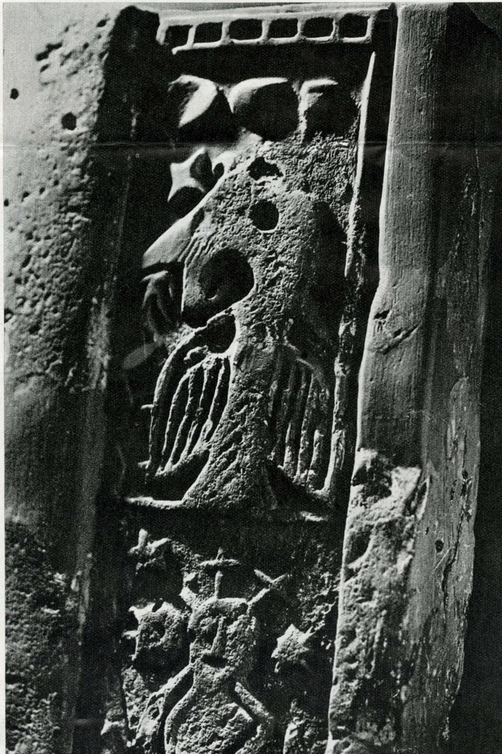
Padlótégla a nyéki vadászkastélyból, sólyom alakjával (XIV. sz.)

Magyar lovas íjász alakja, Lodomér mester esztergomi érsek margitszigeti házából (XIII. sz.)