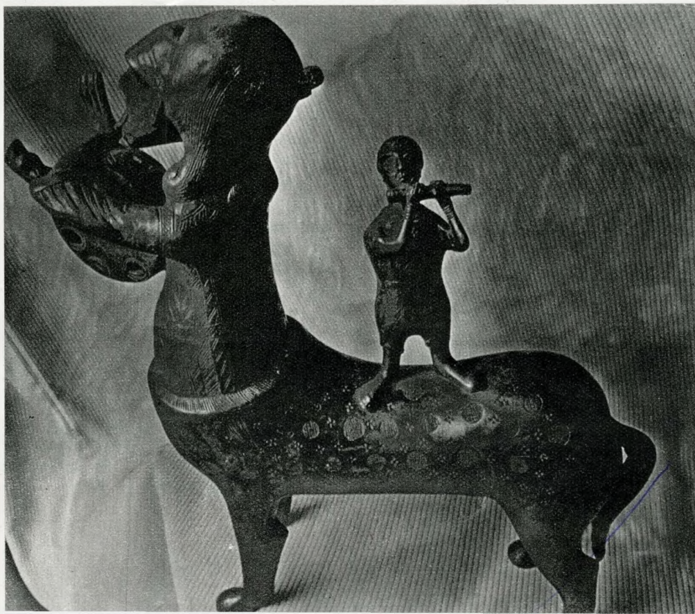
Románkori magyar aquamanile jokulátorok alakjaival. Magyar Nemzeti Múzeum