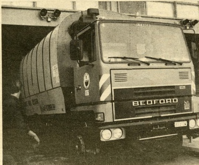
A főváros minden részéből ideérkezik majd a háztartási szemét