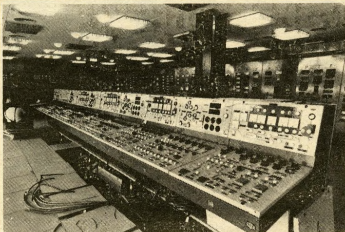
A jól műszerezett üzemen távirányítással vezérlik az automata berendezéseket. A képen: a diszpécserterem