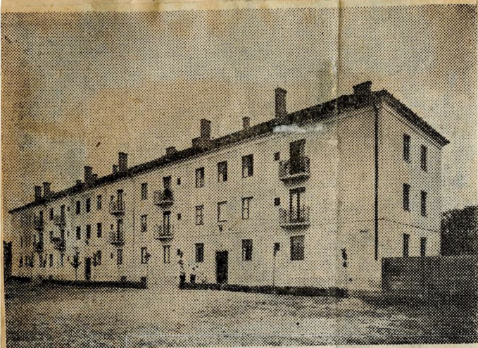
Uj lakóház a Kerepesi úton