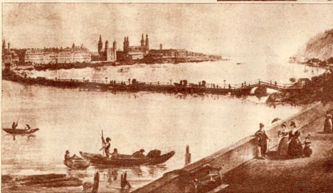
A Lánchíd őse a hajóhid, amely a mai Vigadó és a Várkert között állott.