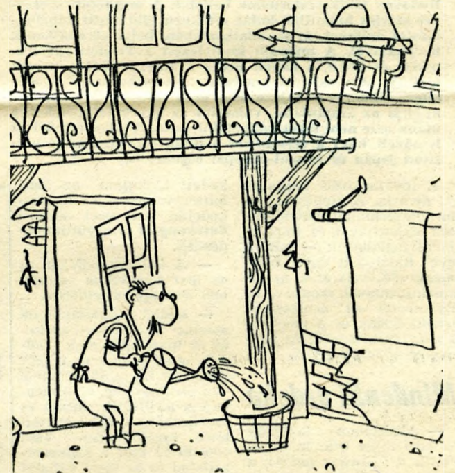
Lehoczki István rajza