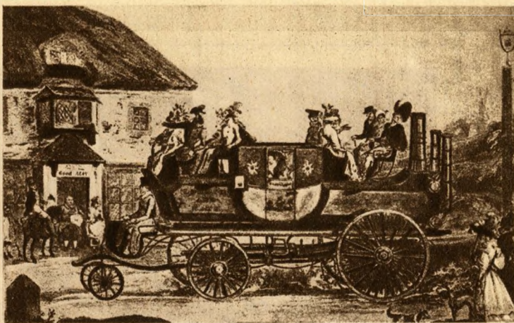
Gurney gőzkocsija Londonban 1827-ben. Alsó kép: Voigtlaender Pesten bemutatott gőzkocsija 1835-ben.

A gépkocsi végre csakugyan eljutott Pestre és 1835 má-