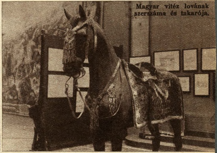
Magyar vitéz lovának szerszáma és takarója.