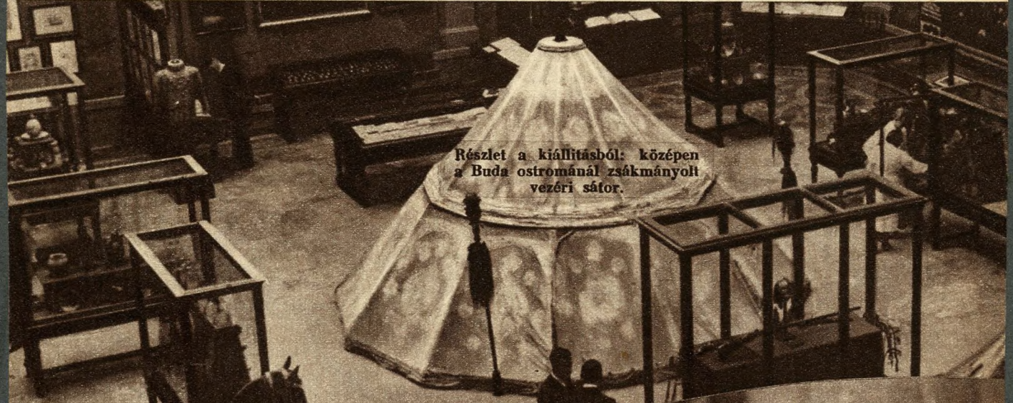
Részlet a kiállításból: középen a Buda ostrománál zsákmányolt vezéri sátor.