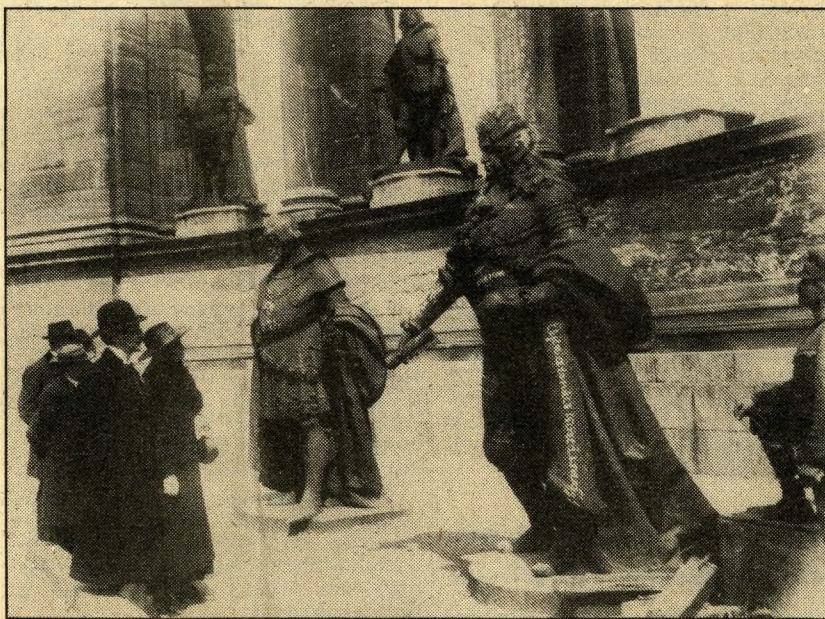
A Tanácsköztársaság idején leszedték a Habsburg-királyok szobrait.

A félbehagyott emlékművön 1926-ban kezdenek ismét dolgozni, és három évvel később avatják fel, a hősök emlékkövével együtt. Ez utóbbit 470 mázsás kötömből készítették; a síremlék a világháborúban elesett