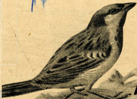
A házi veréb