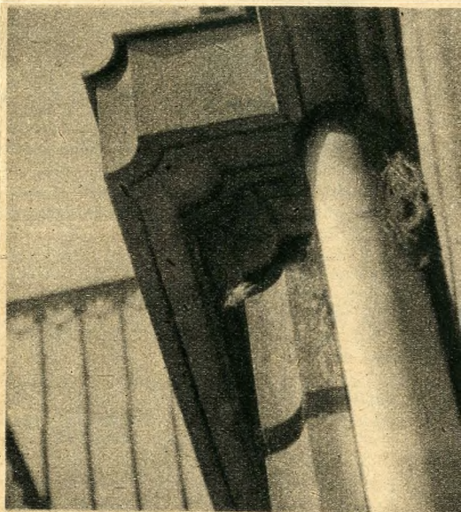
Verébészék egy pesti ház esőcatornája mögött

Nem volna teljes a kép, ha nem emlékeznénk meg a verebek hasznáról. Mert hasznot is hajtanak. Bár magevő madár, a nyári hónapokban igen sok rovarot pusztít el, fiókáit is