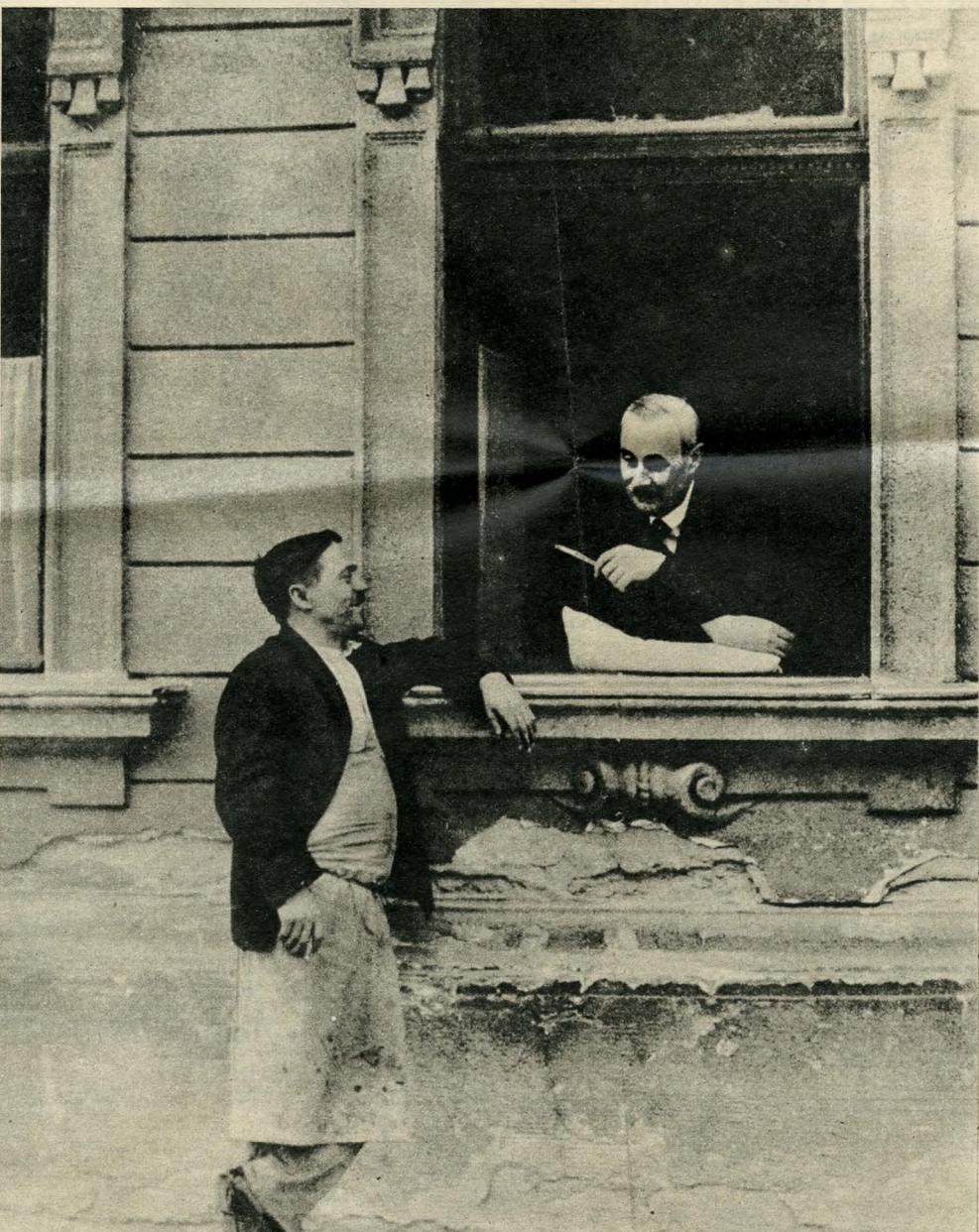
Gábor Viktor reprodukciói

Krúdy Gyula Budapestje címmel, az író születésének századik évfordulója tiszteletére mintegy 300 oldalas kiadvány jelent meg a Fővárosi Szabó Ervin Könyvtár gondozásában. A gyűjtemény szemelvényei — Krúdy Gyula legismertebb regényeinek részletei — idézik a századforduló légkörét, a mindennapi élet szokásait, hangulatát, a társadalom egyes rétegeinek embertípusait, világszemléletüket, életformájukat, gondjaikat és vidámságaikat — a főváros lélegzését, közérzetét közvetítik az olvasónak. Annak a Budapestnek a hangulatát idézi, amelyről Krúdy egyik regényében így írt: „Sokszor megátkoztam ezt a várost, de mindig visszatértem hozzá, akármilyen messzire voltam... Valamely titokteljes varázsa van Budapestnek...” (A kötetet Devecseri Lászlóné állította össze, és az író leánya, Krúdy Zsuzsa lektorálta.)