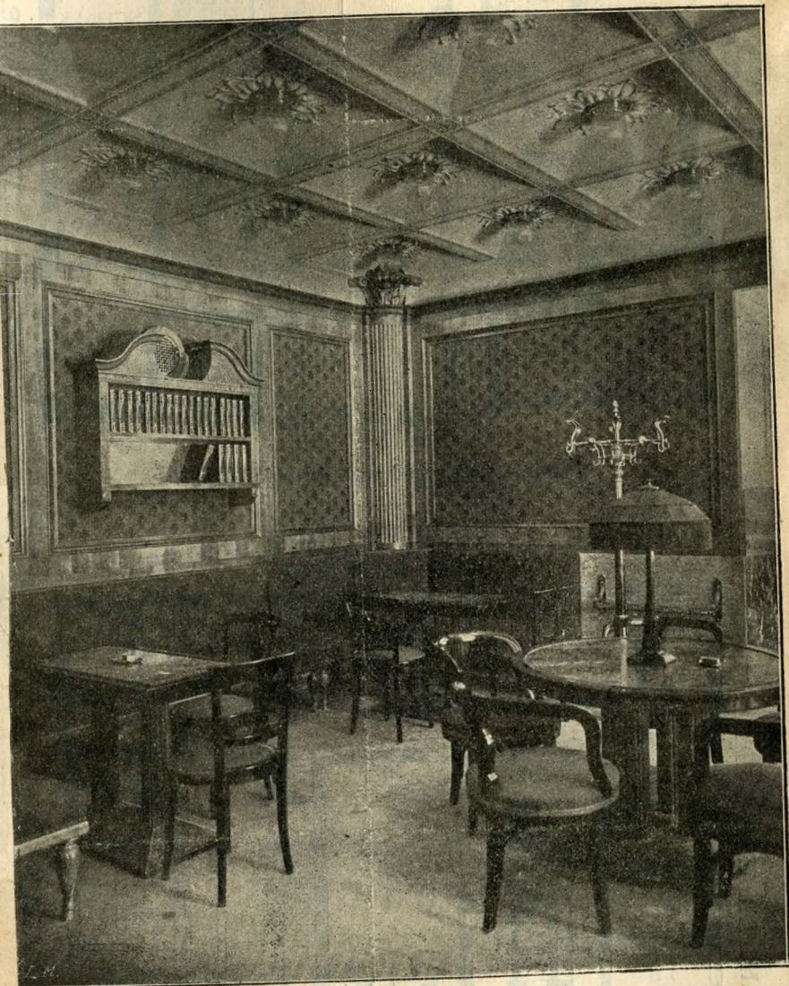
Figur 6. Caf interieur.