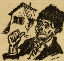
Első osztály: 1200 forint...

A csónakmesterrel lódenkabátos fiatalember, tárgyal éppen egy kajak ügyében. Tőle tudom meg, hogy milyen népszerű sport az evezés. A legnagyobb szezonban vasárnaponként 100.000 ember is van a Dunán. Nagy