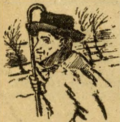
Munkatársunk a viharban.

Vidám kiskacsák fürdenek a viharos Dunában, amikor versenyt futok kalapommal a Római-parti strandon. A kicsit nagyképűen hangzó »Atkélés a Lidóraz« vastábia csikorogva hajladozik az orkászertű jeges szélben, mely a budai hegyek felett havat kavar. Némi nehezteléssel gondolkodom arra a nyájas olvasóra, aki felhívta figyelmemet a Római-parti weekend viszontagságaira: »Igen tisztelt Szerkesztő Úr! — írta. — Nagy érdeklődéssel olvasom a Haladás új rovatát, amely pesti dol-