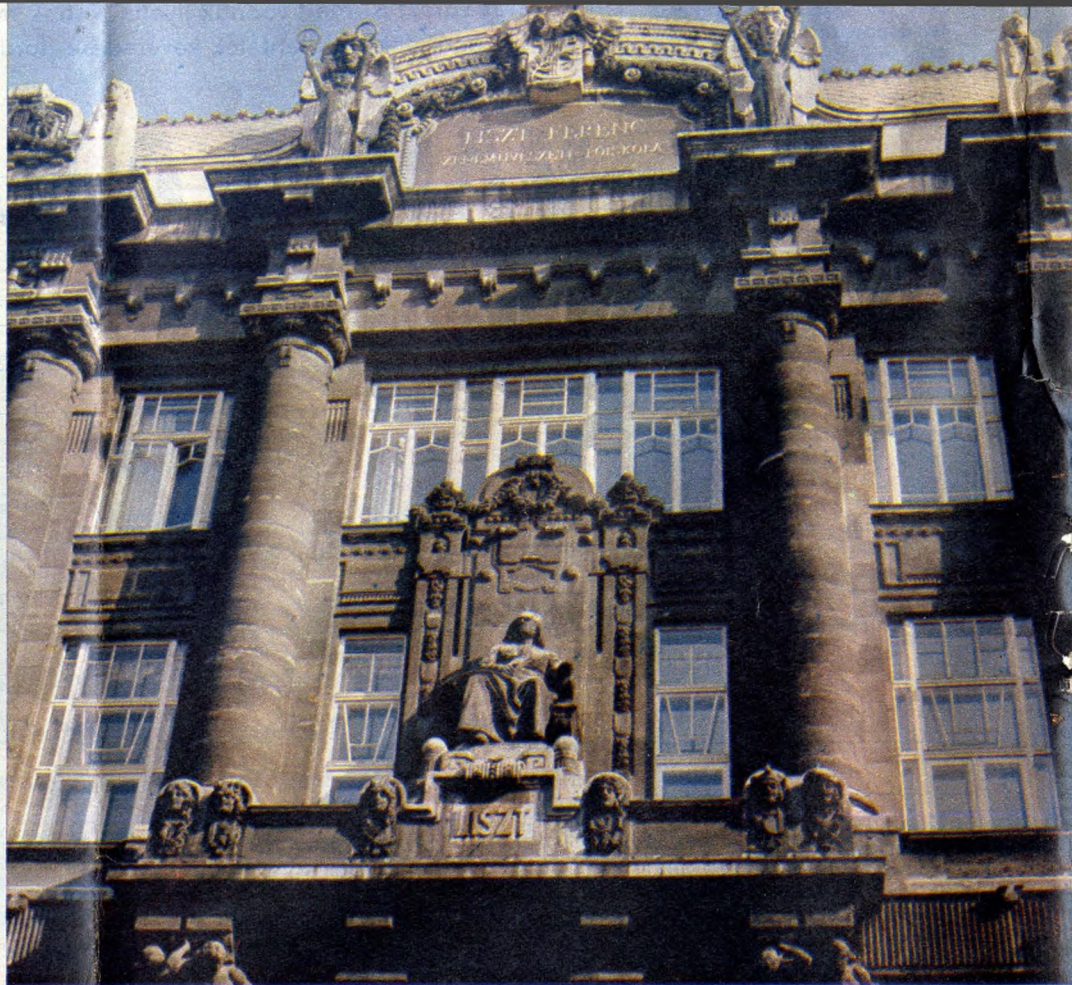
A magyar zeneoktatás háza, a Zeneművészeti Főiskola