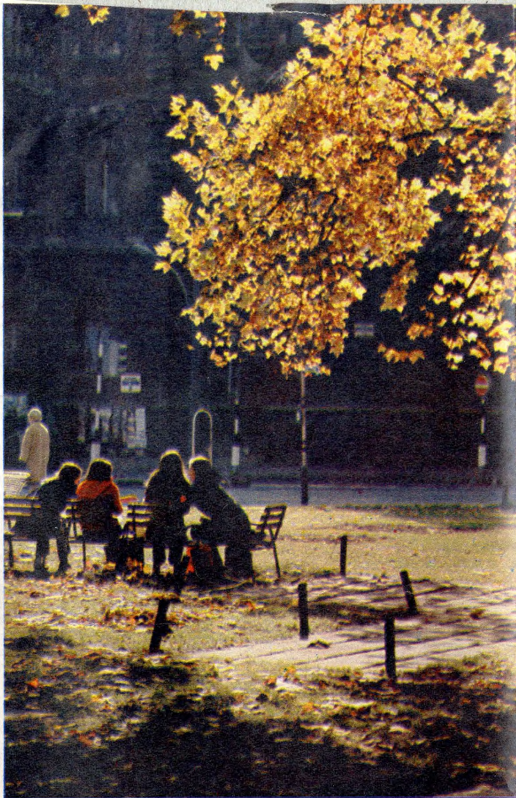
A kevés parkosított terület egy része, a Kodály köröndön található