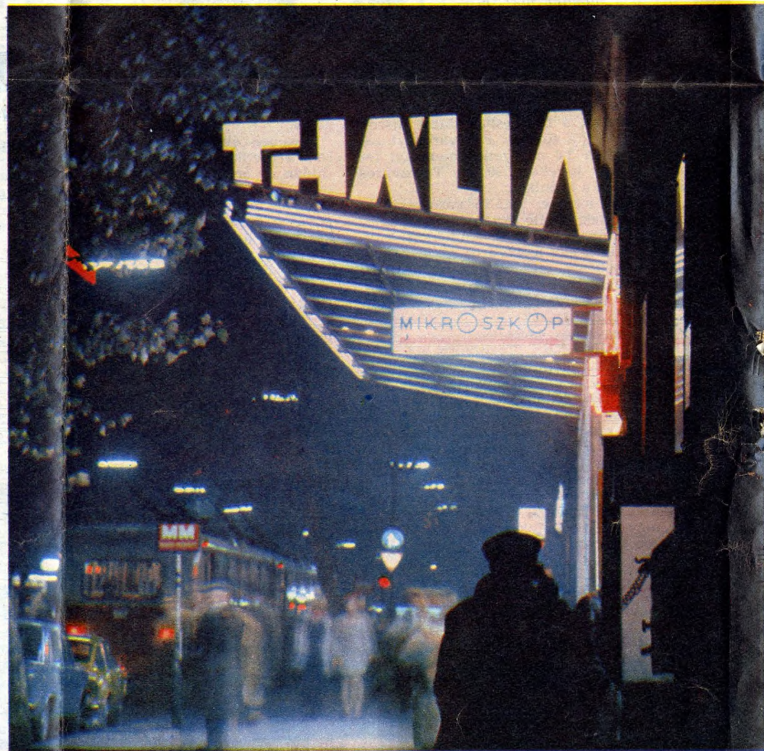
A terézvárosi színházi negyed