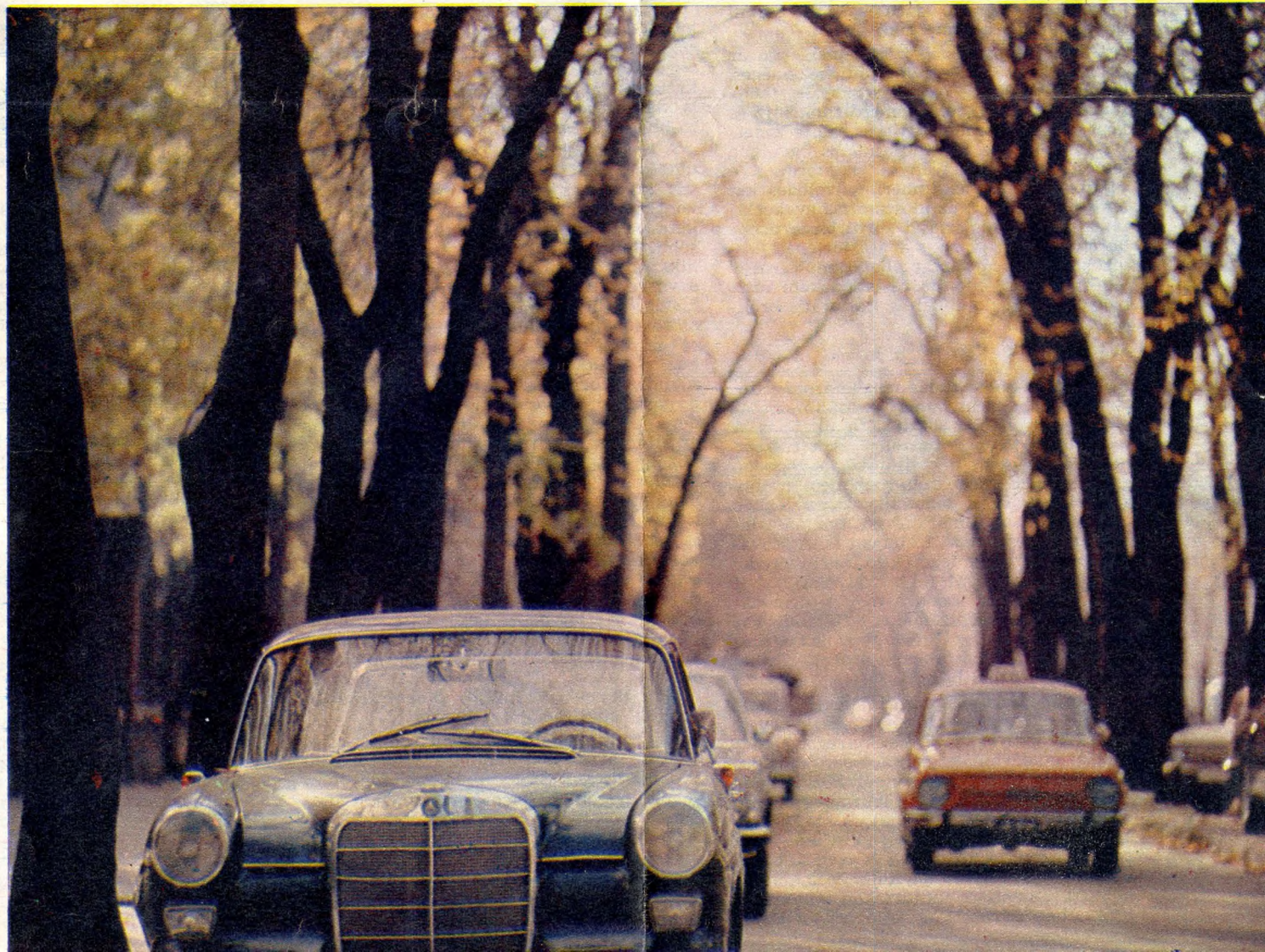
Diplomata- negyed a Gorkij fasorban