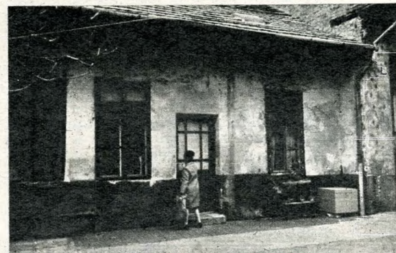
A Terézváros legöregebb háza, az udvarból nézve

Mária Teréziának és Ferenc császár öféléseinek.