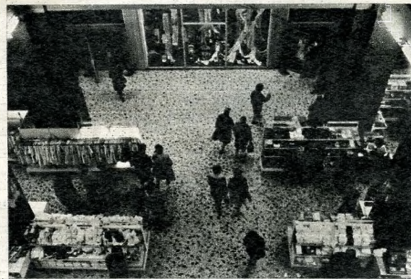
Bárha mindig ilyen nyugalmas lenne a Divatsarnok forgalma