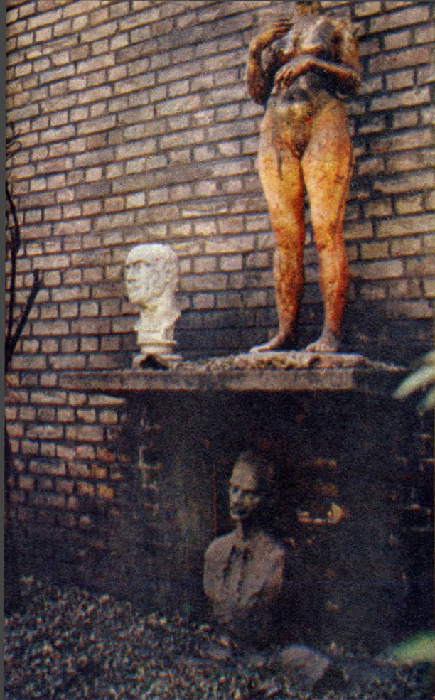
Szobor csendélet az Eprekertben